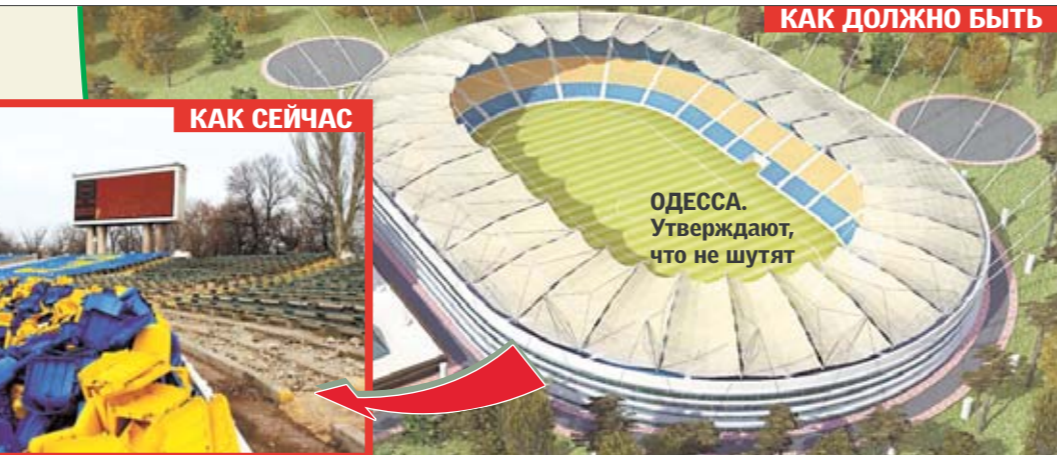
КАК ДОЛЖНО БЫТЬ