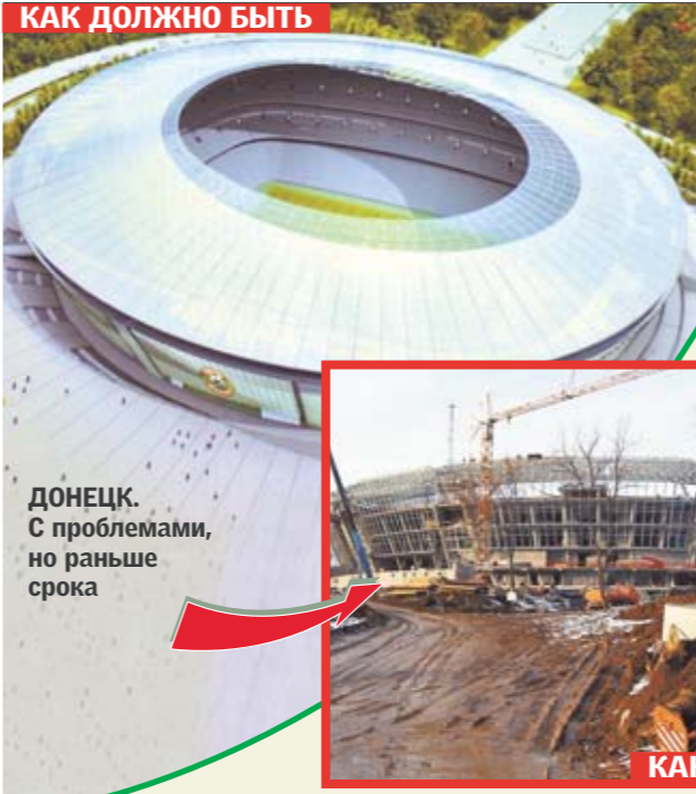
КАК ДОЛЖНО БЫТЬ