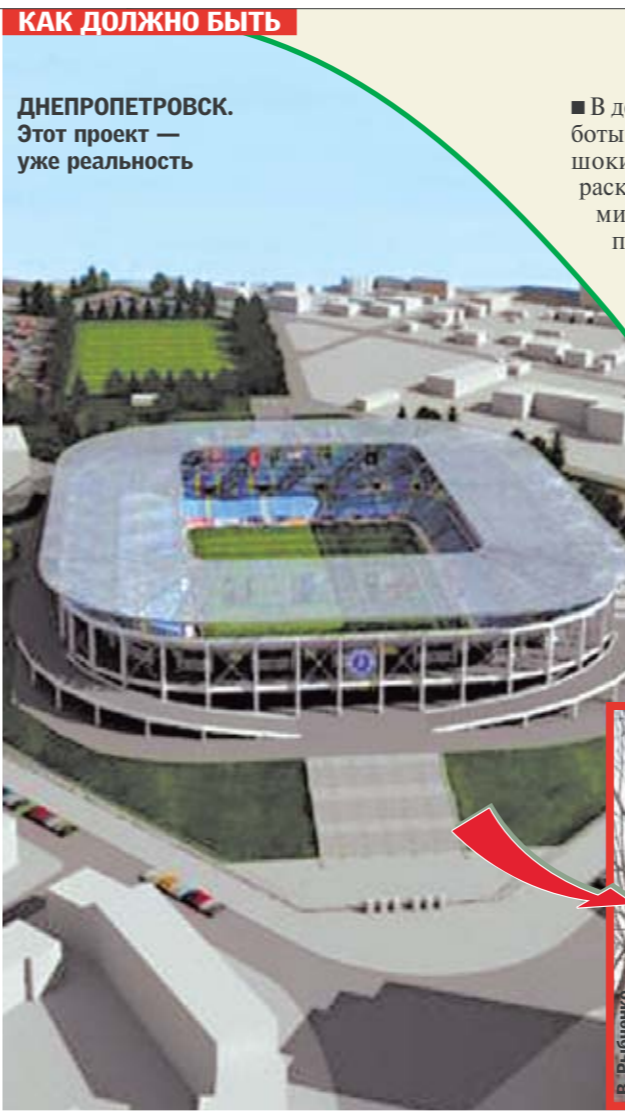
КАК ДОЛЖНО БЫТЬ

ДНЕПРОПЕТРОВСК. Этот проект — уже реальность