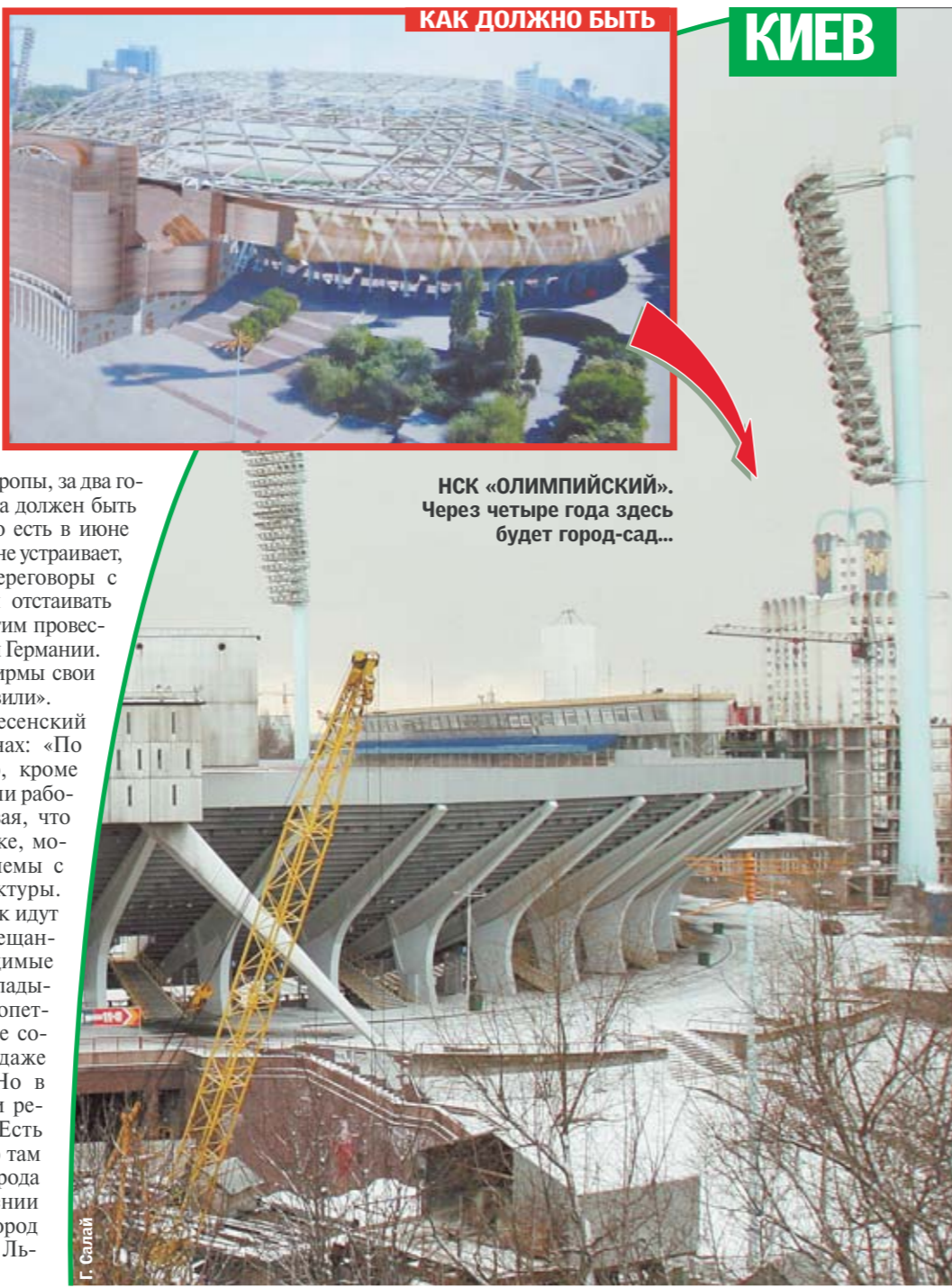
КАК ДОЛЖНО БЫТЬ