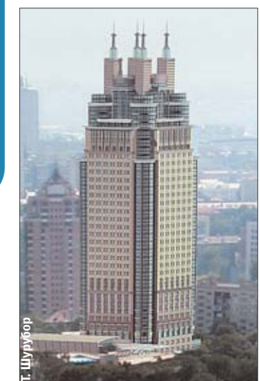
«Сталинку» скрестили с замком

А вот гостиничный комплекс в Кияновском переулке, 13—21, собираются начать строить в этом году. Обещают отель в столичном ретро-стиле, который сможет потянуть звезды на 4.