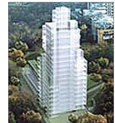
Гостиница в Кияновском переулке с виду на ретро не похожа