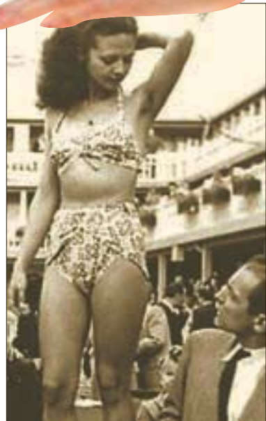
Бикини. Нескрываемый интерес

Вспоминаю знаменитую фразу о «мини-бикини-69» из фильма «Бриллиантовая рука», многие уверены, что открытые купальники появились лишь в конце 60-х вместе с сексуальной революцией и мини-юбкой. На самом деле, это произошло гораздо раньше.