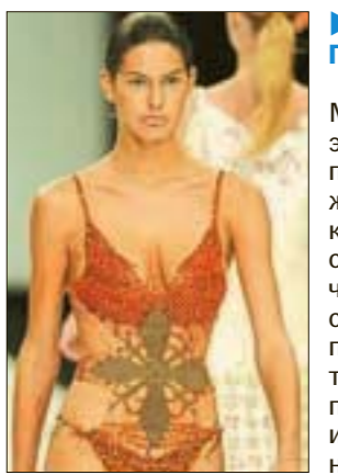
▶ ЗОЛОТАЯ ПАУТИНА

По-прежнему остаются популярными купальники в крупных цветах. Чтобы дополнить ансамбль, к ним рекомендуются подобрать сумку и сапоги