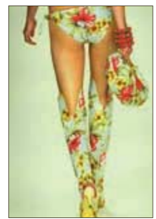
▶ ЦВЕТОЧНЫЙ ПЛЯЖ

Купальники с мячом и национальными флагами на груди дизайнеры разработали специально для болельщиц чемпионата мира по футболу в Германии