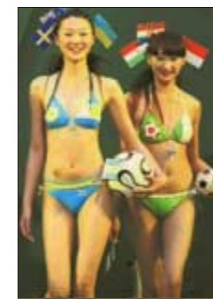
▶ ФУТБОЛЬНОЕ БИКИНИ

Купальники с мячом и национальными флагами на груди дизайнеры разработали специально для болельщиц чемпионата мира по футболу в Германии