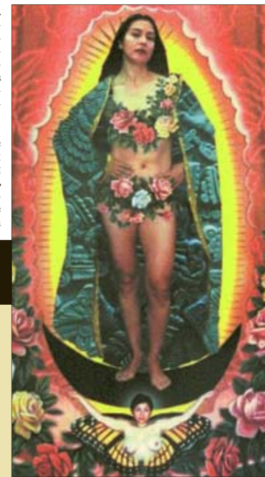
Скандал. Мадонна в бикини Альмы Лопес

ЯПОНСКИЙ ПРАЗДНИК. В Стране восходящего солнца уже многие годы отмечают День бикини, но не шестивем полубнаженных красавиц. Этот день стал национальным праздником борьбы за мир. День бикини — это не торжество купальника, а годовщина