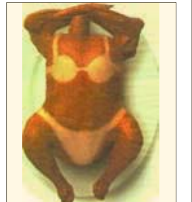
Таймер спасет от ожогов

Цены на бикини в Украине колеблются от нескольких десятков гривен до нескольких тысяч долларов, в зависимости от места покупки. Так, на Троещинском рынке Киева купальник можно приобрести за 60—80 гривен, в магазине известной торговой марки — за 980—1300, а если душа просит чего-то эксклюзивного — добро пожаловать в мультибрендовый бутик. Там вам предложат мини-бикини за 5 и более тысяч гривен. Как известно, совершенство не знает пределов. Модельеры уже не позиционируют бикини исключительно как наряд для купания. Это скорее униформа для пляжных вечеринок и пати у бассейна. Поэтому крохотные кусочки ткани украшают вышивкой, покрывают стразами Сваровски (а иногда и настоящими алмазами), обвешивают модными в этом сезоне цепями (иногда золотыми) и превращают в индикатор благосостояния.