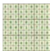
Решения на Su Do Ku, опубликованные 29 сентября

Залпните все клеточки так, чтобы в каждой строке и в каждой колонке и в каждом блоке, выделенном жирными линиями, содержались все цифры от 1 до 9. При этом каждая из этих цифр может присутствовать в каждой строке, каждой колонке и каждом блоке только один раз.