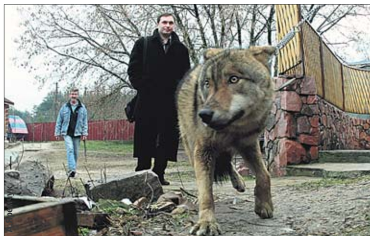
Актер. Сеня вернулся и стал сниматься в кино

«Сегодня» желает малышам и родителям счастья