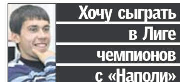
Хочу сыграть в Лиге чемпионов с «Наполи»