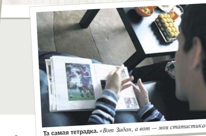
Та самая тетрадка. «Вот Зидан, а вот — моя статистика»