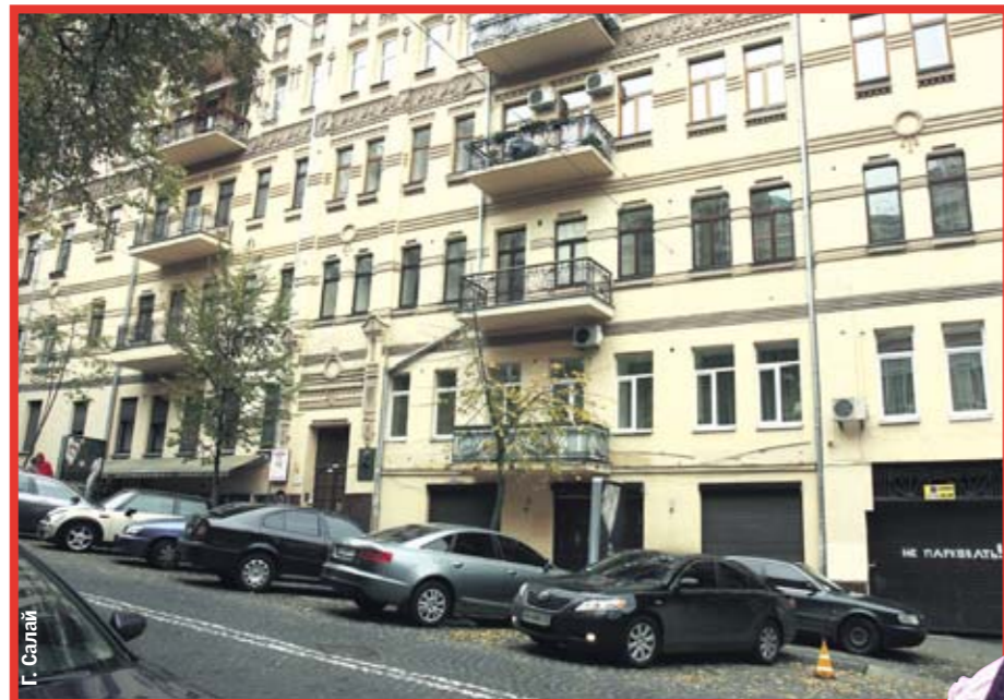
На Городецком. Тут уже несколько лет живет ведущий «Шустер live»

В 90-е эти популярные телеведущие работали вместе в Москве на НТВ. В «нулевые» судьба свела их в Киеве. Если в последнее десятилетие прошлого века Евгений Киселев помогал Савику Шустеру обосноваться в столице России, то в первом десятилетии этого века уже наоборот — второй помог первому обосноваться в столице Украины. Они разные, но у них сегодня много общего. Их программы выходят на разных каналах, но в одно и то же время по пятницам. Они живут рядом: Савик Шустер на Городецком, Евгений Киселев на Заньковецкой. Завтракают в одном и том же кафе «Волконский». «Сегодня» решила выяснить у самых популярных ведущих Украины, как они относятся к работе друг друга, считают ли себя конкурентами и как их работа сказывается на отношениях между ними.