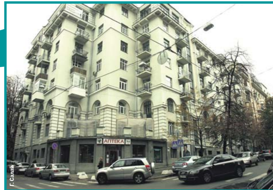
На Заньковецкой. В этом доме поселился автор программы «Большая политика»