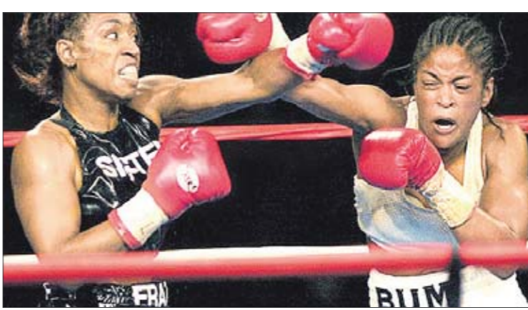
Папины дочки. На Фрэйзер и Али пришло восемь тысяч зрителей

Ну а самая уважаемая женщина в боксе — американка Лейла Али, дочь легендарного Мохаммеда Али. 8 июня 2001 года она провела самый знаменитый бой в истории женского бокса. 8000 зрителей на арене и 100 000 кулпенных прав на телепрямой поединка Лейлы с дочерью еще одного легендарного боксера — Джо Фрэйзера — Джеки Фрэйзер. Победу одержала Лейла,