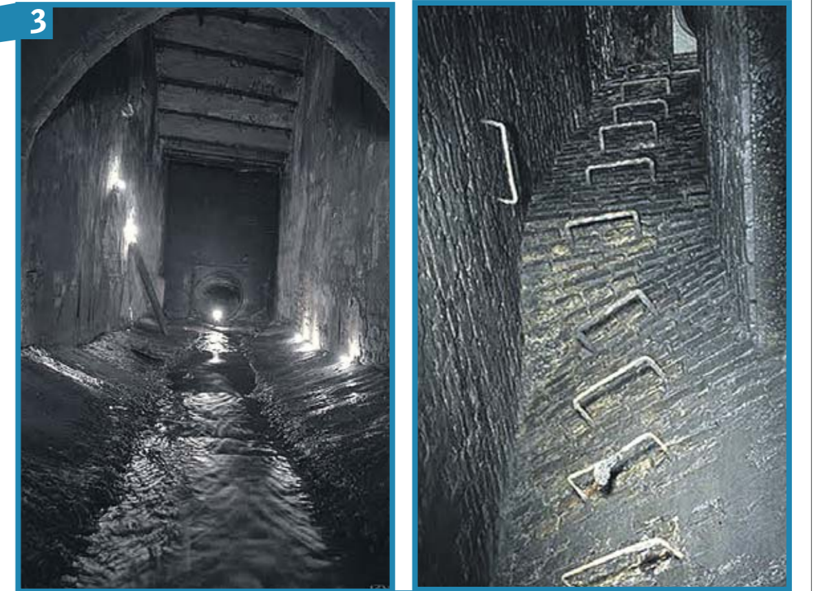
Тоннели под Печерском. В подземелье вполне безопасно, поэтому сюда хотят водить экскурсии

Уцелели три фрагмента Южно-го перехода. Один на Позняках в частном секторе. Перед входом — завод, а в самом канале длиной около 70 метров воды по колено. Второй — на Жуковом