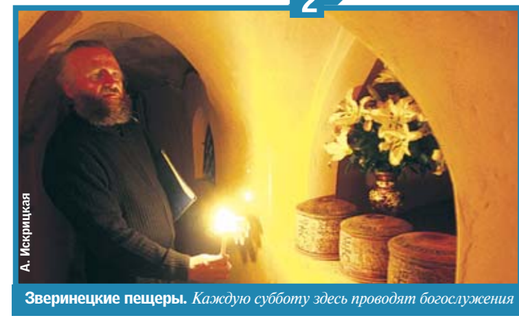
Зверинецкие пещеры. Каждую субботу здесь проводят богослужения

ходы и водить туда официальные экскурсии. Представьте, сколько средств можно заработать для города? Но наши чиновники, похоже, о таком не думают...», — сокращается Кулинич. А недавно сотрудники музея нашли новый объект — стену, которая тянется около 2 километров. Правда, находка засыпана землей, но исследователи говорят, что она сохранилась в идеальном состоянии.