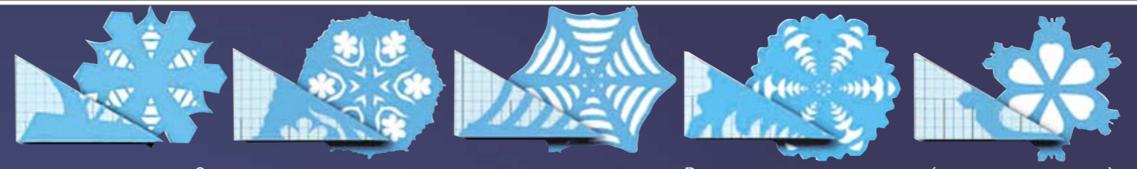
Сложите бумагу в несколько раз так, чтобы получился треугольник. Вырежьте из него узор по схемам (отрезаются белые части).