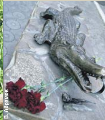
Голзи. Помнят и любят