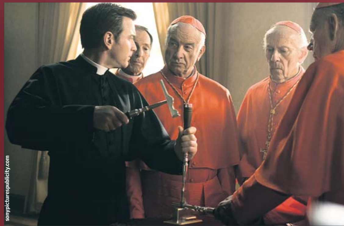
Папа умер. Выбор нового понтифика — вопрос жизни и смерти