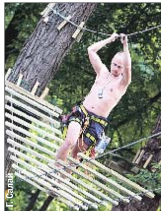
Так выглядит аттракцион