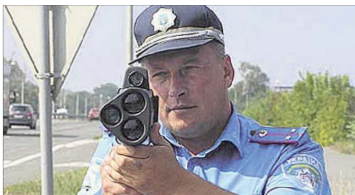
Радары. Измерять вашу скорость будут на 34 улицах

6. Днепровская набережная. 7. Улица Бориспольская. 8. Улица Ревуцкого. 9. Броварской проспект. 10. Улица Бальзака. 11. Улица Ватутина. 12. Проспект Маяковского. 13. Проспект Воссоединения. 14. Улица Гагарина. 15. Бульвар Перова. 16. Пересечение Богатырской и Луговой. 17. Улица Газопроводная. 18. Московский проспект. 19. Улица Полярная. 20. Проспект Дружбы Народов. 21. Бульвар Леси Украинки. 22. Набережное шоссе. 23. Улица Киквидзе. 24. Новая окружная дорога.