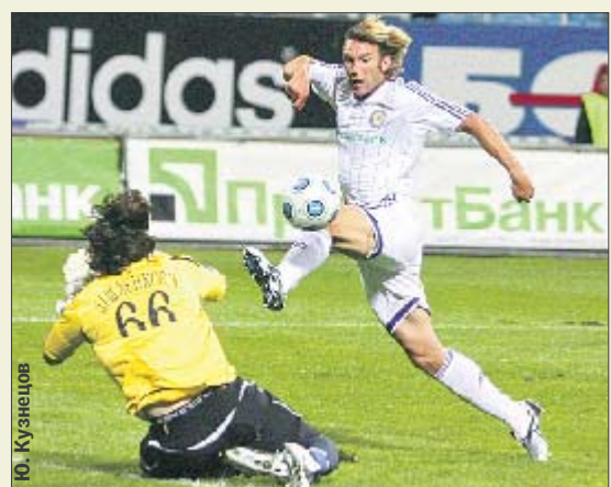
■ 31 августа 2009. Возвращение Андрея Шевченко в «Динамо» произошло в Киеве фуор. Против донецкого «Металлурга» (3:1) Шева вышел на второй тайм. Был не в лучшей форме, но вся команда играла на него. На последней минуте Андрей забил пенальти и сам его реализовал!