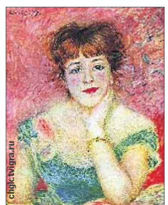
Ренуар. Блюдо из красок

«Вопрос — это не вопрос, а утверждение, которое вы должны подтвердить или опровергнуть» — так говорил Владимир Ленин. Как вы думаете, почему на русской мужской рубашке-косоворотке застежка сбоку? Думаете, дело в орнаменте? По мнению академика Дмитрия Лихачева, дело не в этом. Почему же у русской рубашки косой ворот?