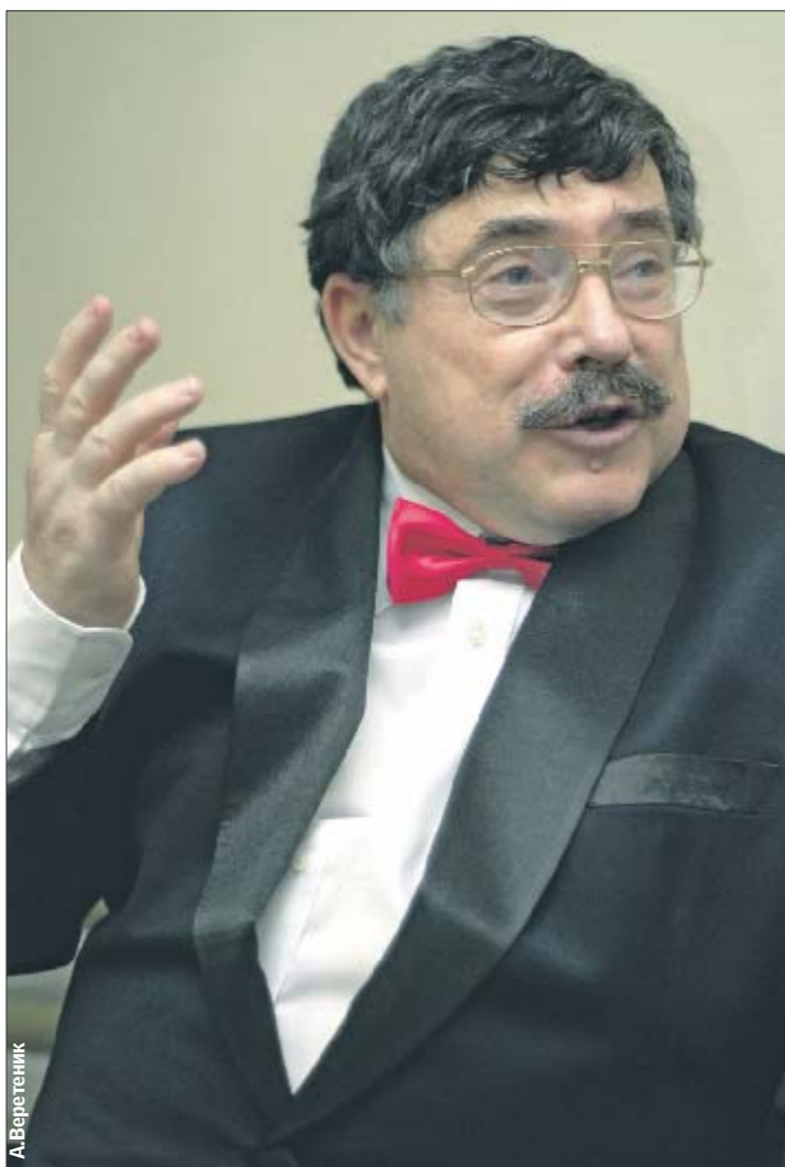
Знаток. С легкой руки Ворошилова стал «ходячей энциклопедией»

Былают красивейшие вопросы. Например: «Второго января 1959 года из Русского музея с шумом и скандалом вынесли картину великого русского художника Федотова. Как называлась картина?». Когда начал вспоми-