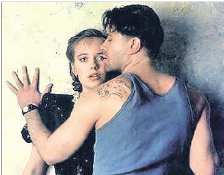
«Вор». Этот фильм с Машковым тоже был номинирован на «Оскар»