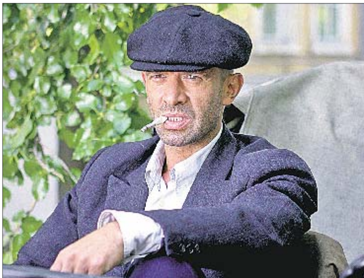
«Ликвидация». Год съемок в Одессе научил его говорить с акцентом