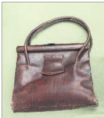
1940. Сумочка Евы Браун, жены Адольфа Гитлера