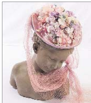
1900. Шляпка из соломки и цветов принадлежала киевлянке