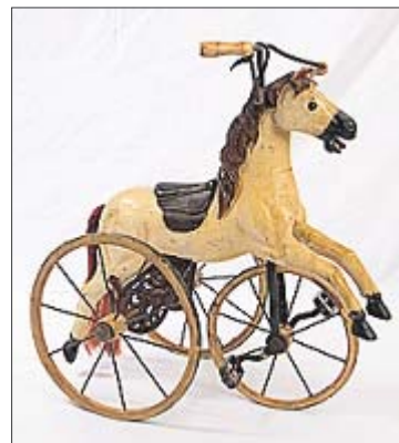
1880. Два в одном из Англии: велосипед и игрушка