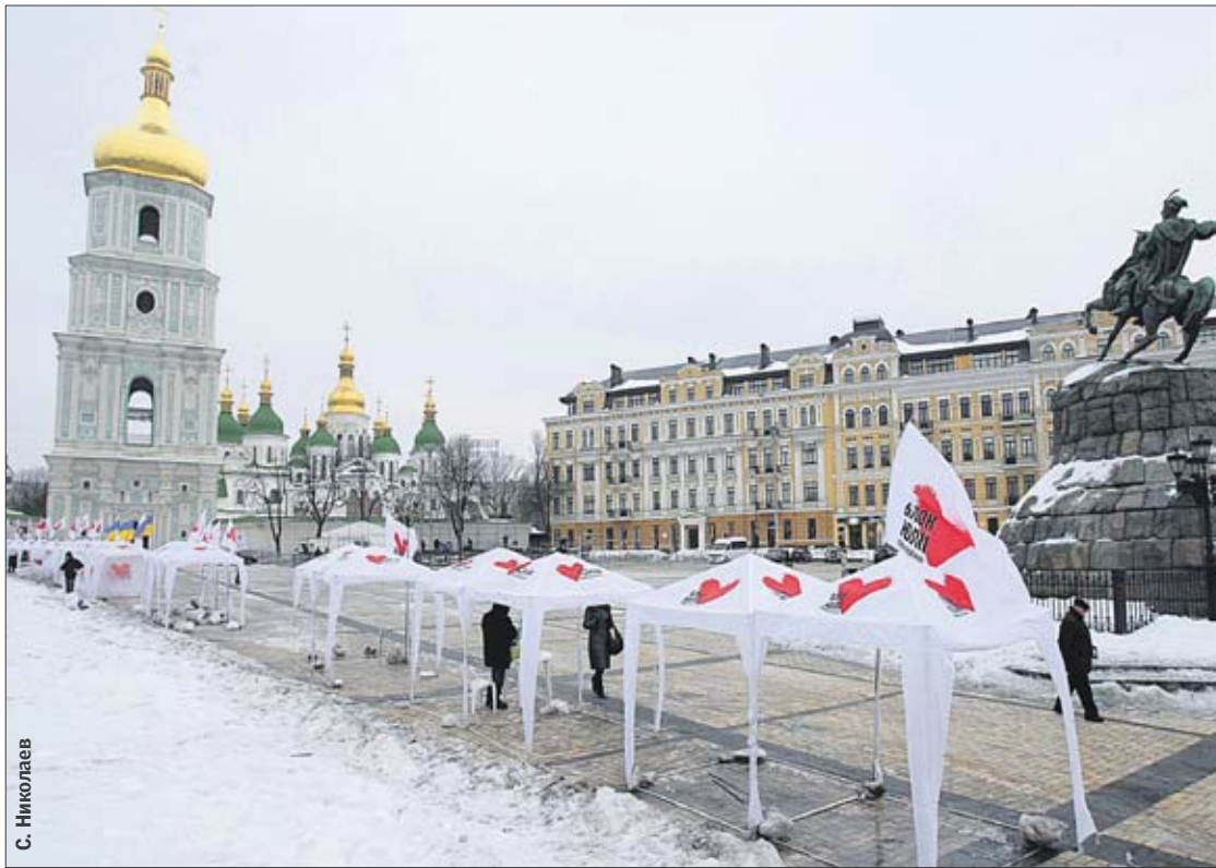
Накануне выборов. На Софийской площади будет гулять БЮТ, а рядом — «Регионы»

РАЗРЫВ. Впрочем, главные события будут после выборов. «Сегодня», переговорив с работниками штабов как Тимошенко, так и Януковича, пришла к выводу, что акции протеста будут, если разрыв в пользу того или иного кандидата составит не более 2—