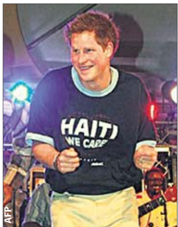
На Барбадосе. Ради $1 тысячи принц пустился в пляс

ПОСЛЕ ЗЕМЛЕТРЯСЕНИЯ ■ СКАНДАЛ С ДЕТЬМИ И РИС ПО ПОЛОВОМУ ПРИЗНАКУ