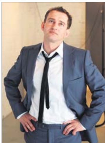
В Киеве. Актер «убьет» брата

Также 11 февраля в Киеве выступит «непара» Потап и Настя (МЦКИ), а 12 февраля там же — российская артистка Елена Ваенга, чьи песни поют Александр Маршал и группа «Божья Коровка».