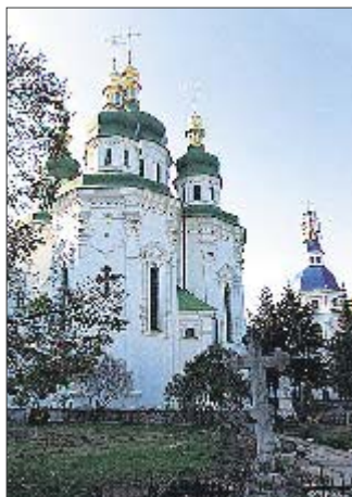
Монастырь пошел трещинами