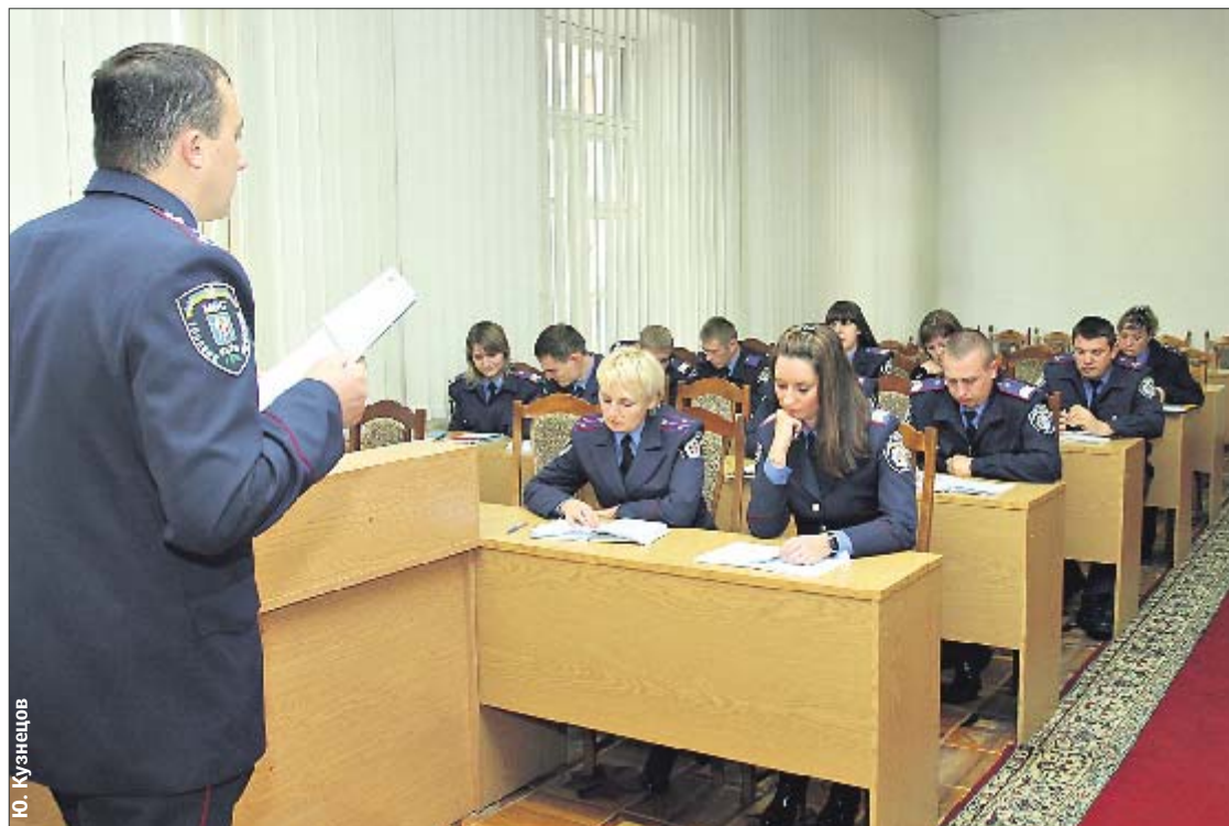
Урок английского. Правоохранители пытаются составить диалог с пострадавшим в ДТП