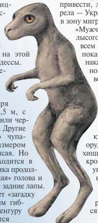
Загадочный зверь убил десятки кролей, но взял с собой лишь двух

Рассказы очевидцев во многом противоречивы. Одни видели зверя ростом 1,0—1,5 м, с бело-желтой или черной шерстью. Другие говорят, что чупакабра — размером с собаку и лысая. Но большинство сходится в том, что у хищника продолговатая «крысиная» голова и сильно развитые задние лапы. Последнее делает «загадку природы» эдаким гибридом пса и кенгуру — перемещается оно прыжками. Любопытно, что существо вызывает у собак панический страх, они даже не пытаются прогнать чужака. Люди говорят: «Глаза светятся красным». Поражает жестокость зверя — кролей он убивает десятками, но с собой уносит лишь одну-две тушки. Некоторые утверждают, что убитые «вампирами» звери — полностью обескровлены. Название чудовища пошло от испанского Chupacabras (chupar — сосать и abra — коза, «сосущий коз», или «козий вампир»). Впервые заговорили о нем в Пуэрто-Рико в середине 70-х. Он был похож больше на пресмыкающегося или кенгуру с шипами вдоль хребта. Кожа — серо-зеленая, глаза — навыкате, как у инопланетян. Интересно, что в мифологии славян