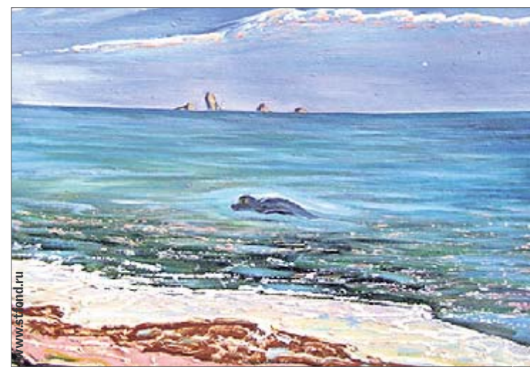
Пейзаж с чудовищем. Нарисован на Керченском полуострове Крыма