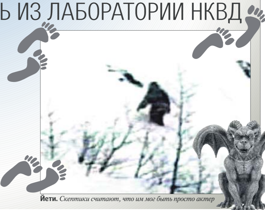
Йети. Скетники считают, что им мог быть просто актер