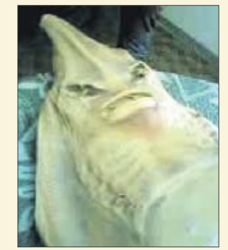
«Русалка». Или скат?