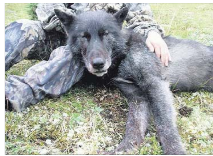
Волкопес. Смешанные «браки» часто случались в 1950-х

Загадочный обитатель Азовского моря — на www.segodnya.ua в разделе «Видеогалерея»