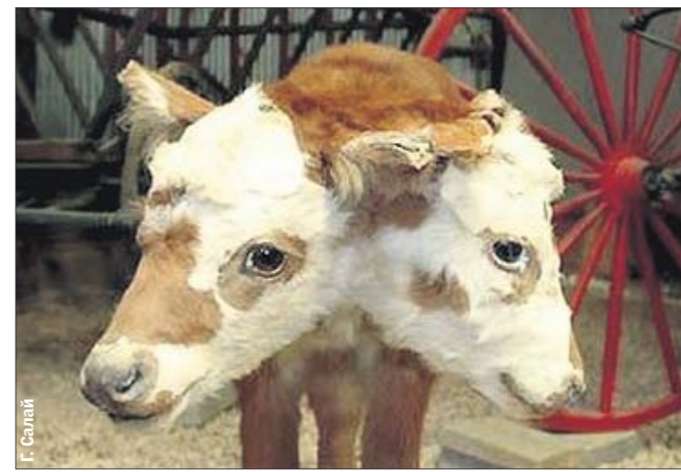
Теленок. Это существо умерло вскоре после рождения

ледние волки-людоеды жили в 1950-х годах на севере Житомирской области. Там от кляквой одной пары погибло несколько десятков человек». А есть ли в Украине вервольфы? «Еще в 1980-х жили старики-вовкулаки, умели лечить, но все свои секреты уже унесли в могилу», — говорит Сергей. — Дело в том, что у нас оборотни никогда не считались злыми силами. Славянские князья, монгольские ханы, да и запорожские казаки — могли оборачиваться хищниками, но, конечно, не буквально. С помощью особых методик входили в транс. В измененном состоянии сознания находили ответы на волнованные их вопросы или получали дополнительные силы для сражений, как берсерки».