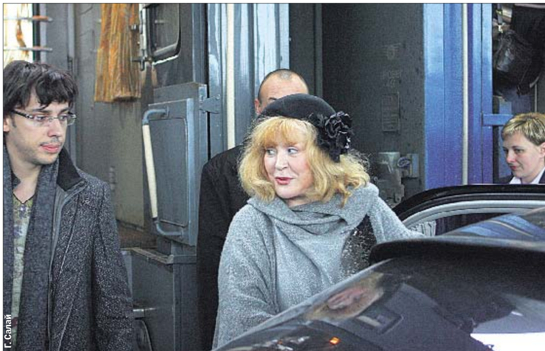
Из поезда — в «мерс». Уезжая в «Премьер Палас», Примадонна призналась, что будет Максму комедию ломать