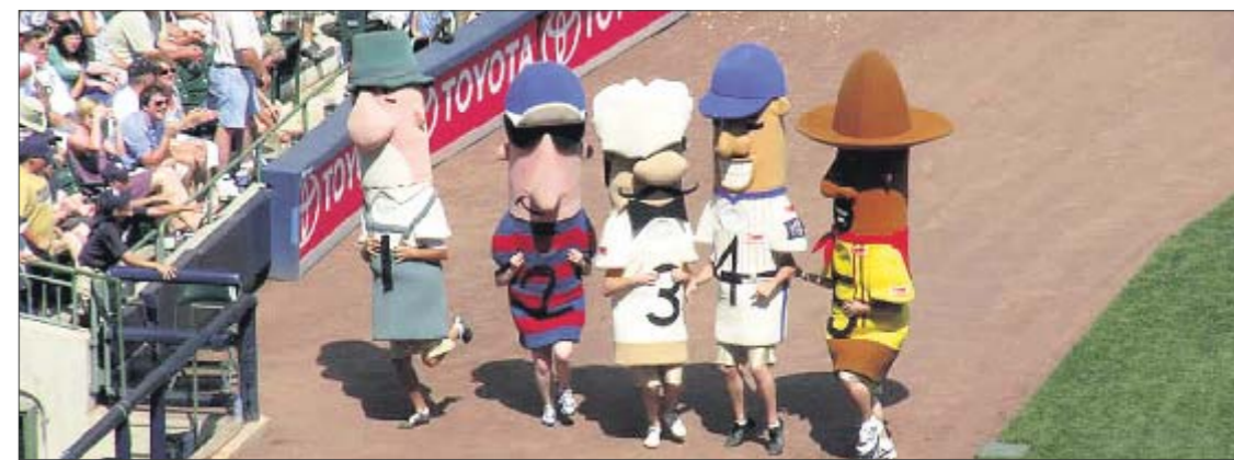
На старт. Пятерка «вкусных» талисманов бежит к финишу в перерыве бейсбольного матча

Обычно в костюмы колбасок облачаются работники бейсбольного клуба или стадиона, однако в последние годы нередко талисманами одева-