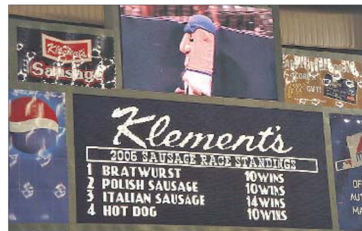
По ранжиру. Турнирная таблица колбасных гонок

ются известные бейсболисты и спортивные журналисты. А в 2003 году во время забега случился курьезный инцидент. Бейсболист команды «Питтсбург Пайретс» Рендалл Саймон выбежал на поле и ударил по голове талисману итальянской колбасы. Одетая в костюм девушка не пострадала, но упала и сбила с ног хот-дог. Польская колбаска помогла пострадавшей подняться и добежать до финиша. А Саймона дисквалифицировали на три игры. Сбитая девушка в качестве моральной компенсации попросила себе битку с автографом бейсболиста-хулигана.