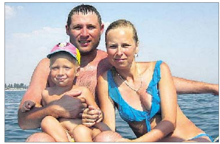
Вдова таксиста. «Теперь учусь жить заново»

Добавим, что в конце октября Демиденко был осужден к 5 годам условно с отсрочкой наказания на 3 года, и на 3 года у него отобрали права.