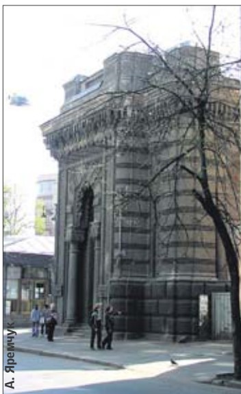
Дом актера тут был 30 лет