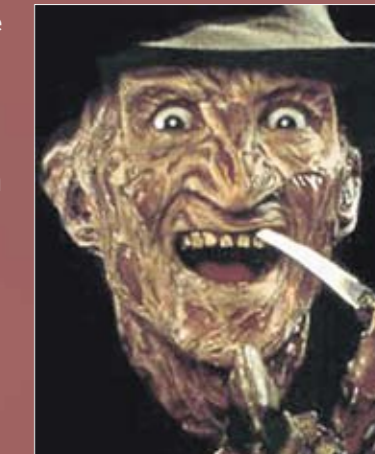
Инглунд. Заработал зуд от грима