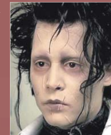
Депп. Так ходил по 9 часов в день

«Эдвард — руки-ножницы» с многочисленными шрамами и нездоровой бледностью приходилось ежедневно тратить по четыре часа. А носить грим Делпу нужно было минимум по 9 часов в день. К концу съемок актер настолько наловчился, что даже сам помогал гримеру накладывать на себя шрамы и наращивать волосы. Что любопытно, гримеры справляются со своей задачей далеко не всегда. Например, на съемки пятой части похождения Гарри Поттера режиссер был вынужден пригласить группу по спецэффектам, чтобы те с помощью компьютерной графики и легкой шетинки с лиц главных героев, потому что грим оказался бессильно скрыть все эти безобразия.