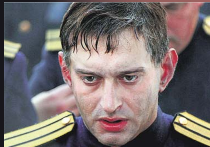
Адмирал. Все дело в краске, парике и красивой форме