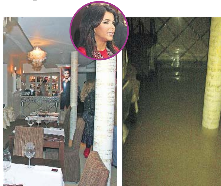
Ресторан Лорак. Так он выглядел до потоп и так — во время него