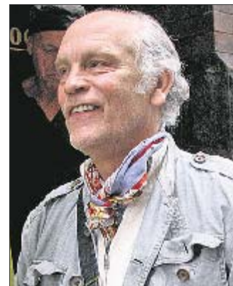
Малкович. Готовит фестиваль

■ Американский актер и режиссер Джон Малкович («Опасные связи»), который сейчас находится в Москве с театральной постановкой «Вариации Джакомо», обмолвился, что на днях собирается заглянуть в Ялту. Здесь он хочет посетить дом-музей Чехова и театр им. Чехова, за судьбой которых, по словам актера, следил последние несколько лет и теперь хочет увидеть, в каком состоянии все находится. Заинтересованность Малковича проста — в этом театре он собирается провести международный театральный фестиваль. В театре уже готовятся к приезду актера и нас заверили, что смогут принять голливудских звезд, мол, и ремонт есть, и сцена хорошая. Кстати, Малкович уже приезжал в Украину три года назад в компании еще одного голливудского актера — Кевина Спейси («Красота по-американски»). Кроме того, Джон собирается нагреть и в Южную Пальмиру — на открытие Одесского международного кинофестиваля, который пройдет в июле (к слову, там же ждут Никиту Михалкова, Дмитрия Дюжева, Гошу Кученко и Федора Бондарчука).