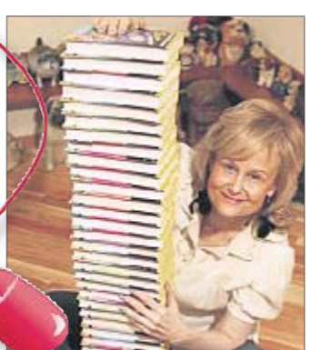
Дарья. Стахановка от пера

■ О том, что знатная детективщица и лентяйка от кулинарии (так писательница сама себя шутливо называет) Дарья Донцова просто помешана на очаровательных мопсах — ни для кого не секрет. Потому даже в таком деле, как ведение онлайн-дневника, писатель-