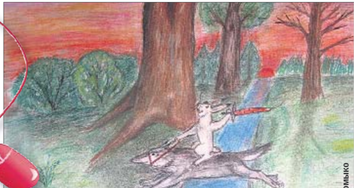
Иллюстрация к сказке. Кто не понял, заяц — это Иван-царевич

■ Как шутит писатель-фантаст Громыко: «Данный журнал ведется для развлечения его хозяйки, а также назойливого пиара ее литературной деятельности». Основными темами «ведьмы» (так несерьезно называют ее фанаты — за одноименный юмористический цикл) стали... крысявки — то