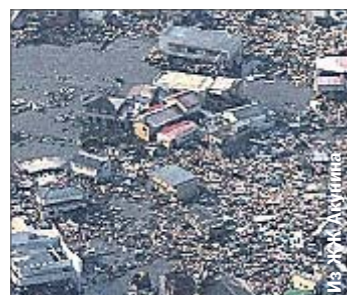
А сегодня. Его уже нет

единственный способ задать ему интересующий вопрос и получить на него ответ. Вопросы разные: от «Кто придумал изменить финал в фильме «Турецкий гамбит?» — до «Ваше отношение к чек-листам?». Акунин часто пишет о своей любимой Японии и делится итогами обзона своих тамошних знакомых после недавних землетрясений. Весьма увлеченно почитает свои впечатления от поездки в Севастополь. К примеру, его поразило, что за все время пребывания в городе он не слышал ни одной фразы на украинском: «Севастополь показался мне очень и очень русским городом». При этом БА регулярно проводит опросы (по типу: «Верите ли вы в суверенитет?» и «Каким событием в истории своей страны наиболее гордитесь?»), организывает фотоконкурс (суть которого: прислать три карточки одного человека, но в разные толы жизни, а читатели пытаются угадать по ним его историю жизни). По дизайну — один из самых красивых ЖЖ.