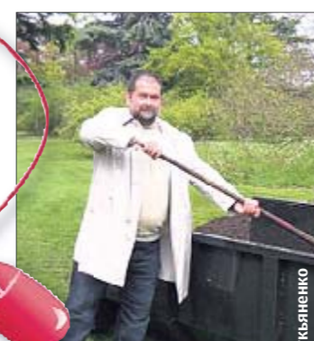
В саду. Удобрят навозом

■ Это уже второй по счету ЖЖ творца «Дозоров» Сергея Лукьяненко (предыдущий он закрыл в знак протеста, поскольку в пылу спора выяснилось, что большинство читателей посчитали допустимыми усыновления российских детей иностранцами — против чего фантаст был категорически против).