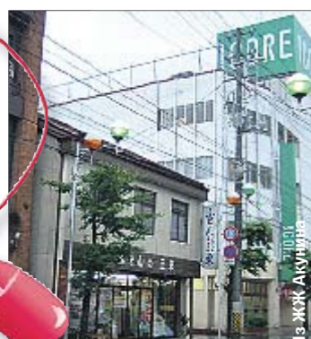
Япония. Вчера мир был таким