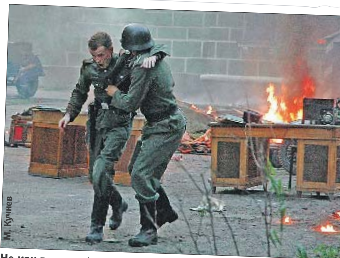
Не как в кино. Актера массовки сильно обожгло и контузило

ЛОВИЛИ «БРИГАДИРА». Главный герой картины Сергей Безруков прибыл в Харьков из Москвы рано утром, чтобы сняться в нескольких сценах. В одной из сцен, которые удалось подсмотреть «Сегодня», его герой — футболист Николай Раневич — бежит по киевским улицам в начале войны. Здесь у главного «бригадира» не было слов, главное — пробежать по узкому тротуару вслед за паникующей толпой. «Смотрите, это же Саша Белый! Пойду за телефоном!» — перебивая друг друга, кричали местные мальчишки, увидев актера. После пятого дубля всех отпустили отдыхать. Под присмотром ассистентов Безрукова тут же увели в прицепной домик