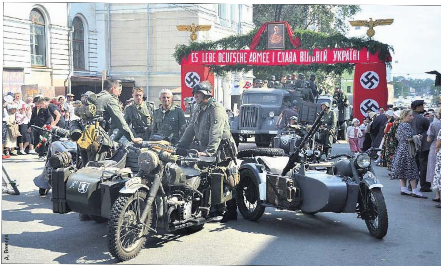
Как в 1942-м. По улице Университетской ездили ряженые фашисты, как 70 лет назад по киевскому Крещатику

Вчера съемки развернулись на двух площадках на улице Чеботарской. Актеры были на площадке уже в десять утра, по проекту съемок в Харькове киношные Безруков и Боярская в одном кадре не пересекаются, играют параллельные сцены, однако Сергей и Елизавета расхаживали рука об руку по съемочной площадке. От жаркого солнца актеров прятали под черными зонтами ассистенты. Боярская появилась на площадке в сценическом костюме: синей плиссированной юбке, легкой бежевой блузке, голубом пальто в горох и белой шляпке. В перерывах между дублями и сценами актриса то и дело говорила по мобильному.