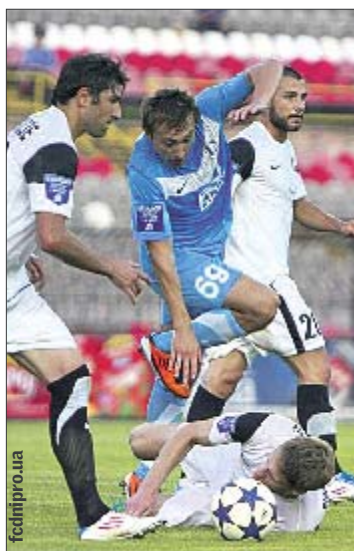
Снайпер №1. 2 матча — 4 гола

— Никогда не кричит. Все доступно объясняет. Для меня в