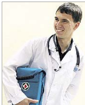
Интерн. Судьба в руках комиссии

Но в то же время уже в другом документе — Порядке трудоустройства выпускников государ-