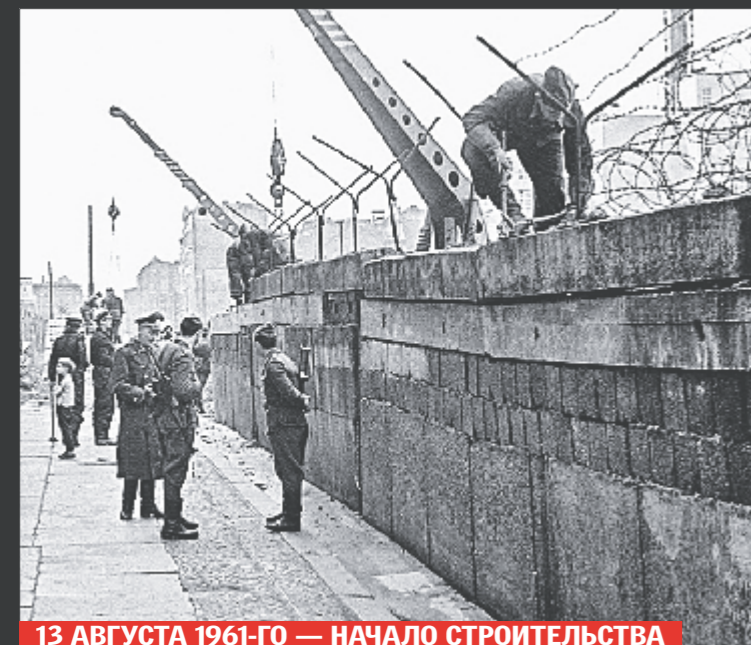
13 АВГУСТА 1961-ГО — НАЧАЛО СТРОИТЕЛЬСТВА