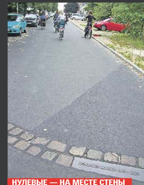
НУЛЕВЫЕ — НА МЕСТЕ СТЕНЫ