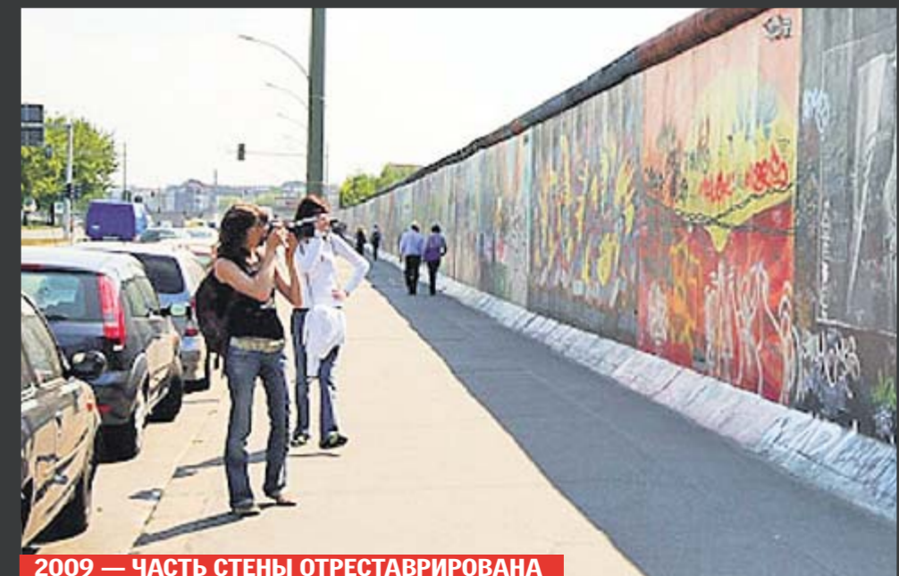
2009 — ЧАСТЬ СТЕНЫ ОТРЕСТАВРИРОВАНА