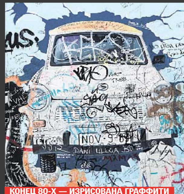
КОНЕЦ 80-Х — ИЗРИСОВАНА ГРАФИТИ