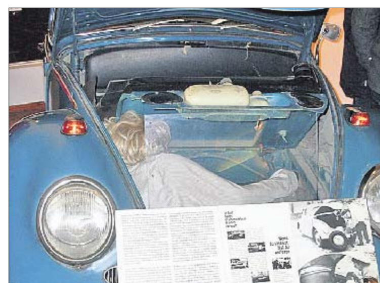
Автосекрет. Пограничники не догадывались проверить и мотор

В начале восьмидесятых для побега использо-