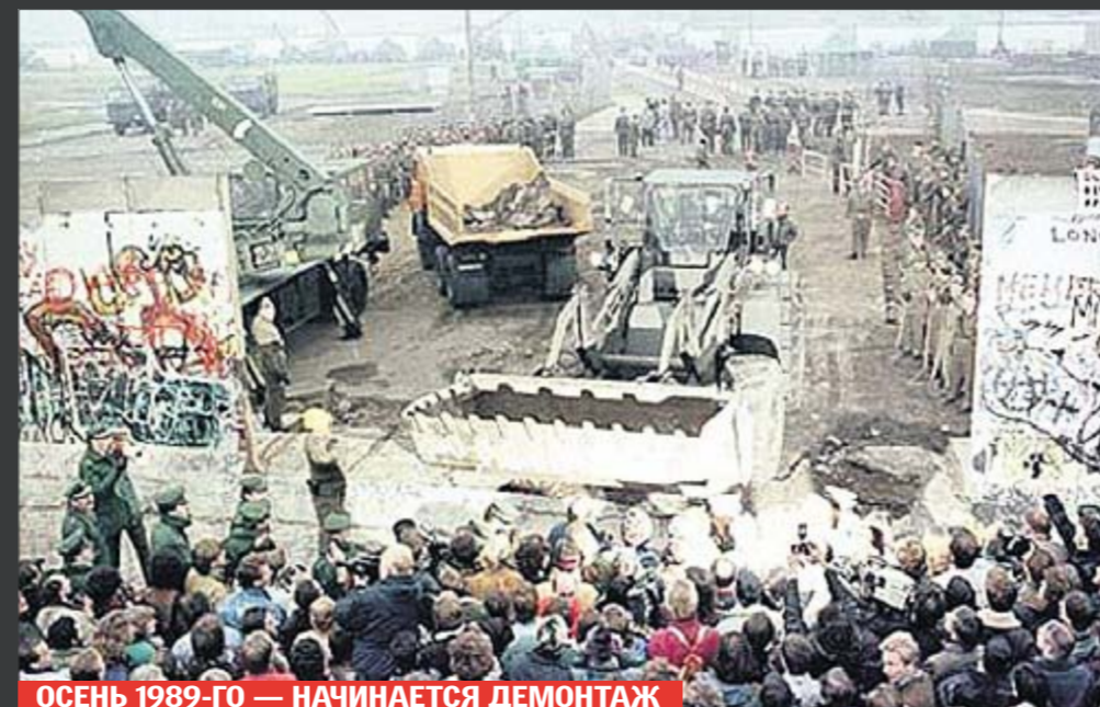
ОСЕНЬ 1989-ГО — НАЧИНАЕТСЯ ДЕМОНТАЖ