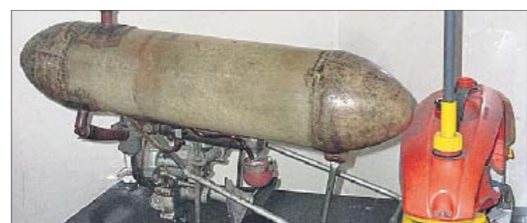
Мотор. После удачного побега патент на него купили спасатели