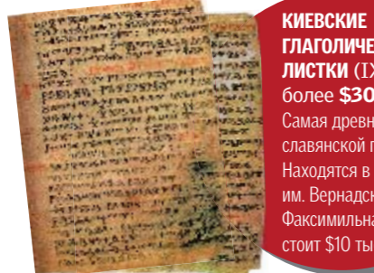
КИЕВСКИЕ ГЛАГОЛИЧЕСКИЕ ЛИСТКИ (IX век) — более $30 млн Самая древняя памятка славянской письменности. Находятся в библиотеке им. Вернадского. Факсимильная копия стоит $10 тыс.