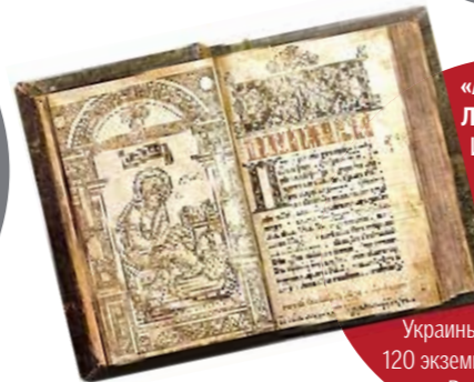
«АПОСТОЛ ЛЬВОВСКИЙ» Ивана Федорова 1574 года — $520 тыс. Первая точно датированная книга, напечатанная на территории Украины. Сохранилось 120 экземпляров. В библиотеке им. Вернадского — 5 экз.