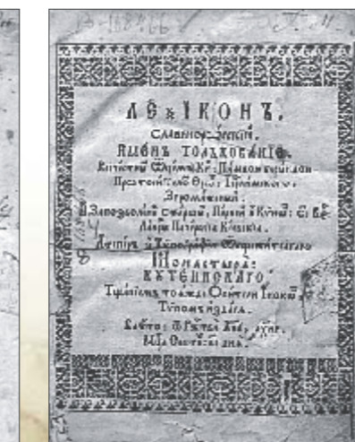
Уникальные издания. Хранятся в комнате редкой книги, в которую почти никого не пускают