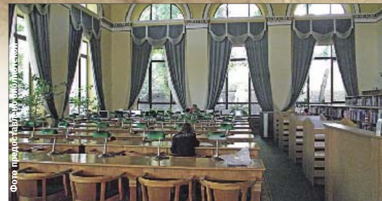
Парламентская библиотека. В читальном зале, как во дворце

Фоторепортаж из главных библиотек смотрите на www.segodyna.ua в разделе «История»