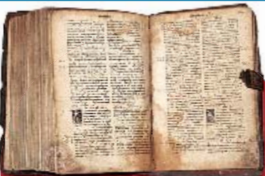
«ОСТРОЖСКАЯ БИБЛИЯ» Ивана Федорова $75 тыс. — 250 тыс. Первое завершённое издание Библии на церковнославянском языке. Экземпляры есть в библиотеке Вернадского и Парламентской библиотеке.

«Пересопницкое Евангелие» стоит более $30 млн, а «Кобзарь» 1840 года — $20 000