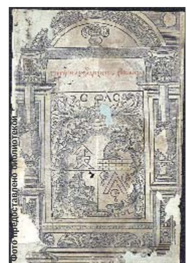
Раритет. «Апостол Львовский» Ивана Федорова 1574 г.

Библиотека им. Вернадского — лучшая в Украине и одна из лучших в мире (раньше входила в десятку, а по последним рейтингам — на 18 месте). Тут хранится около 15 млн единиц: книги, журналы, карты, ноты, изобразительные материалы, рукописи, старопечатные издания, газеты. Именно здесь — самое полное в Украине собрание памятников славянской письменности и рукописных книг. Здесь есть документы, начиная от зарождения письменности (клинописные тексты 3 тыс. л. н.э.), а также одно из богатейших собраний древних памятков славянской письменности, рукописных книг XI—XVIII века, исторических документов XVI—XVIII века. Например, 7 страниц «Киевских глаголических листков» (X век), Оршанское Евангелие XIII века, «Киево-Печерский Патерик» (1553—1554) и всем известное «Пересопницкое Евангелие» (1556—1561), на котором дают присягу на инаугурации президенты. Отдельного внимания заслуживают 8 тыс. томов древних славянских книг, напечатанных кириллицей — среди них «Острожская Библия» 1581 года и «Грамматика Мелетия Смотрицкого». Множество редких изданий XVIII—XX века («Енеида» Котляревского 1798 года, «Кобзарь» Шевченко 1840 года, прижизненные издания произведений Пушкина, Карпенко-Карого, Леси Украинки и др.). «У нас огромный фонд рукописного наследия. Все это хранится в специальных сейфах, шкафах, при особой темпера-