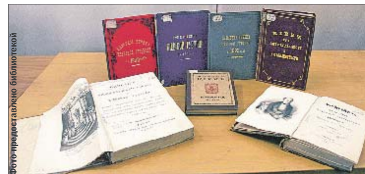
Издание Лавры. Слева — «Описание Киево-Софиевского собора», 1825 г.