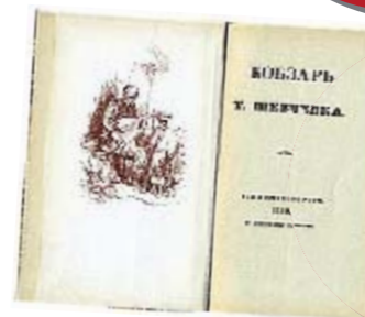
«КОБЗАРЬ» Тараса Шевченко 1840 года — $20 тыс. Прижизненное издание. Хранится в библиотеке Вернадского.

Источник: библиотеки, эксперт антикварного букинистического магазина «Классика» Юрий Егоров