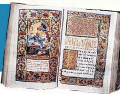
«ПЕРЕСОПНИЦКОЕ ЕВАНГЕЛИЕ» (1556—1561 гг.) — более $30 млн Уникальная рукописная памятка староукраинского языка и искусства XVI века. Хранится в библиотеке им. Вернадского. На нем дают присягу наши президенты.