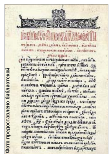
Пересопницкое Евангелие для инаугурации президентов возят в Раду на бронированном авто с вооруженной охраной

туре, каждый день проверяется влажность, их иногда проветривают — ведь документы тоже иногда должны подышать свежим воздухом. У нас есть большой фонд редкостной и старопечатной книги, где собрана уникальная коллекция старинных изданий, в том числе большая коллекция инкунабул — эта самые первые книги, которые появились буквально в первые 50 лет от начала книгопечатания. У нас их около 500. В мире