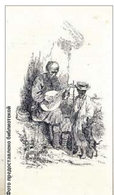
Иллюстрация из «Кобзаря» 1840 г.