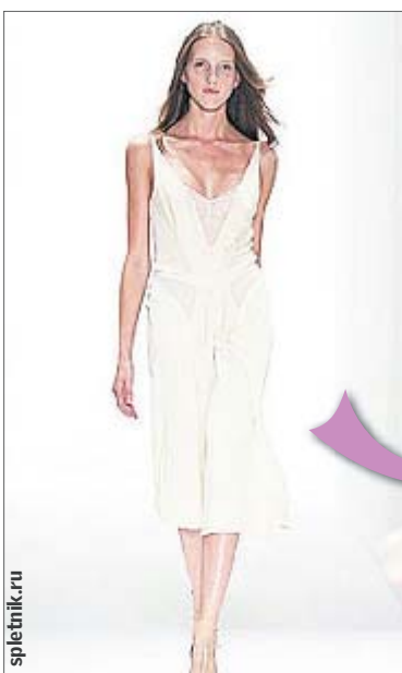
Белый костюм от Кляйна