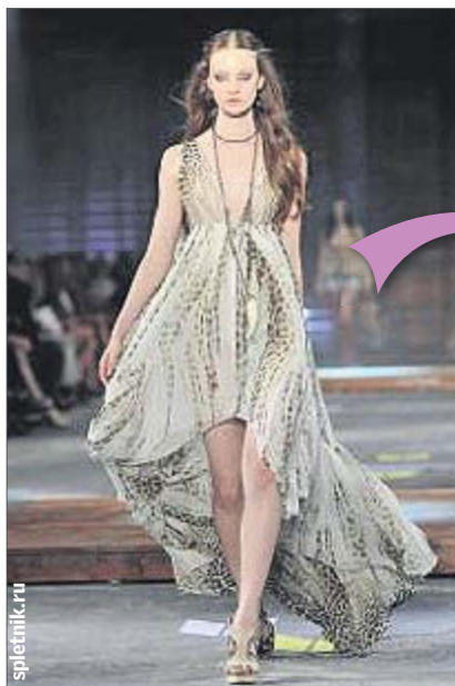
У Кавалли — разная длина подола