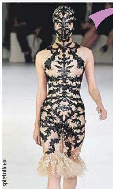
McQueen обмотали головы тканью