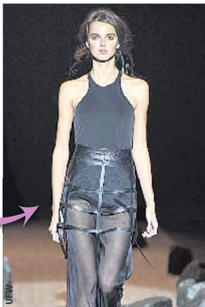
И почти такое же — LUVI