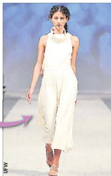
А этот — от Пустовит