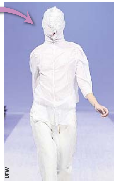
Буренина — тоже, но попроще