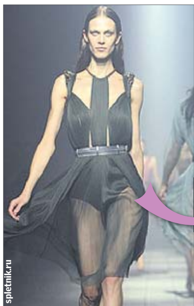
Полупрозрачное платье Lanvin