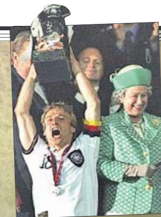
К-3. Клинси, кубок и королева

на все уговоры остаться, подал в отставку. «Самое большое мое желание — вернуться к семье, которой был лишен последние два года», — сказал Юрген и укатил в свой домик в Калифорнии. Выманить его оттуда не удавалось