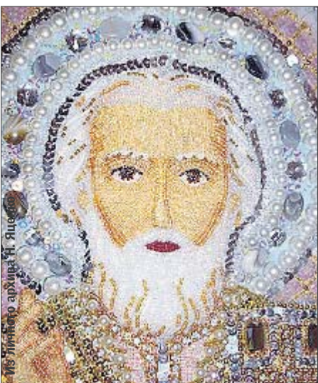
Николай. Лик святого вышит бисером