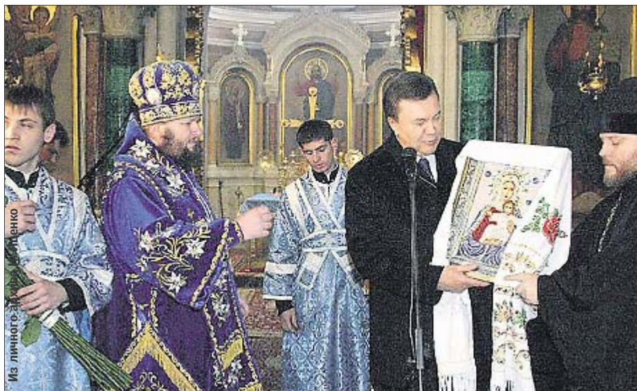
Подарок. Икону мастерицы Виктор Янукович презентовал Сумскому собору