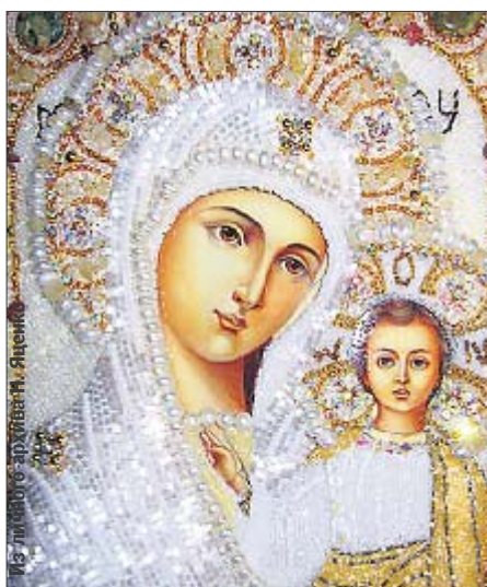
Святые. Одежды и нимбы из жемчуга