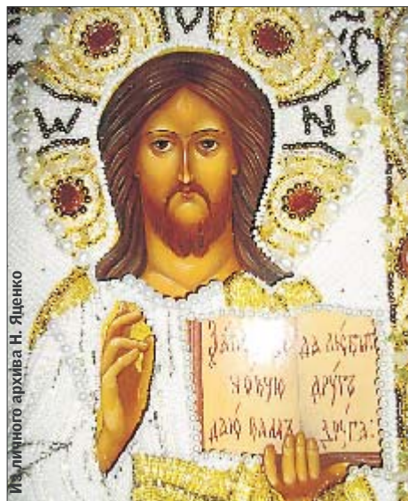
Иисус. Создан с помощью иглы и лески

За рукодельные иконы иностранцы готовы платить от 500 грн.