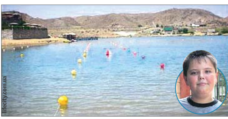
Гиблое место. Ограждают в купальный сезон буйками

■ В 60 м от берега в с. Юрьевка у Азовского моря — Бермудский треугольник в миниатюре. Каждый год на глубине всего чуть больше метра тонут люди! Один из жутких случаев: в 2009 году погибли двое взрослых мужчин, которым вода и до пояса не доходила, спасая 13-летнего Вадима Трохмана. После мальчик рассказывал, что почувствовал, как у него из под ног уходит дно, все, что он мог — это позвать на помощь. Говорят, что это место выпягивает из человека силы, парализует и он начинает тонуть. Но,