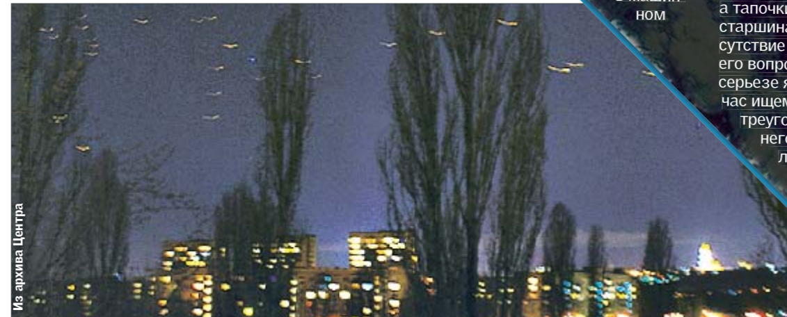
«Армия захватчиков». Оказалась запущенными ради развлечения фонариками в столице