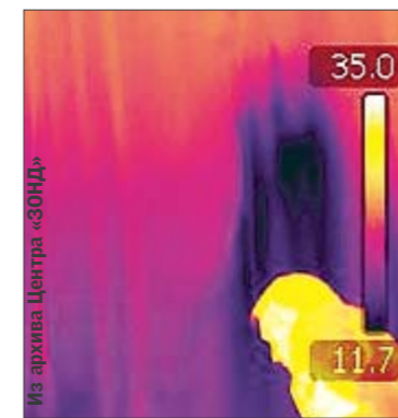
Тепло. Излучает даже интерьер

■ В обычной квартире на Оболони в Киеве вот уже 12 лет живет полтергейст. Дает о себе знать постукиваниями, сначала жил в одной комнате, потом распространился по всем. Центр изучения аномалий «Зонд» подтвердил, что звук не имеет локацию, а тепловизор показал, что тепло наблюдается даже около занавесок. Семья постоянно болеет, жалуются на чувство тревоги, но избавиться от «барабашки» их не смог даже священник. Экстрасенсы утверждают, что дело в сыне, который пропал в Америке. Мол, так он — или его душа — рвется на родину.