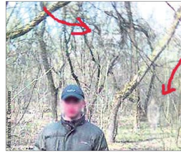
На фото. Силуэт человека и лик меж веток на дереве