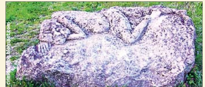
Мангупский мальчик. Якобы сталкивает туристов с обрыва

однажды чувствовал необъяснимую боль в груди, задыхался прямо у себя дома без всяких причин: не был болен и не чувствовал ничего подобного ни до, ни после», — говорит один из местных жителей. Сущности, забирающие энергию, называются лярвами — от лат. larva — привидение, а ущелье Джан Дере — «Ущелье духов» по-турецки. Потому считается, здесь есть Мангупский мальчик, который уже сотни лет бережет сокровища своей семьи, спрятавшие от турок: сбрасывает кладоискателей в ущелье и отнимает у них силы. Охота за сокровищами — очень азартное дело, вызывает целую бурю страстей. Вот ими-то и могут подпитываться лярвы. Хотя здесь — сплошь обрывы, а за кустами их сразу не увидишь — упасть невозможно. И мистики, возможно, в падениях нет.