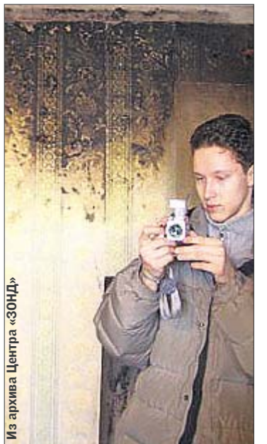
Горело. В нескольких местах