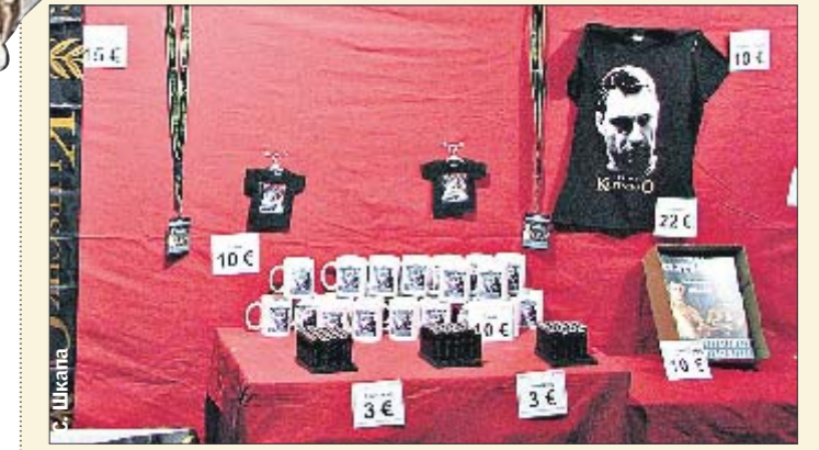
Цена на Кличко. Футболка — 22 евро, чашка — 10 евро

вят на скачки и футбол». В арене в день боя кассы закрыты, билеты проданы. Но с рук взять можно, их предлагают сразу у выхода из трамвайной остановки, откуда до зала еще добрых метров двести. Номинал 89 евро отдадут за 70. А когда я ухожу, в спину кричат: «За шестьдесят пять!». В зал напротив Lanxess Arena съезжаются вилы — для них там до и после боя накрыто выпить-закусить. Потом некоторые из них говорили: если бы чуть дольше задержались на «разогреве», могли бы все пропустить! «Обычным» болельщикам тоже было где разгуляться в ожидании главного события. Разнообразие максимальное: наряды с обьявками для Германии пивом (3,50 евро за 0,4 л), сосисками (от 3 евро) и картошкой фри, предлагали шампанское, мороженое, пасту. Еще, конечно, сувенирную продукцию от Кличко — буклеты, футболки, перчатки. Из необычного — бинокли по 5 евро для тех, у кого места на верхних ярусах 20-тысячной арены.