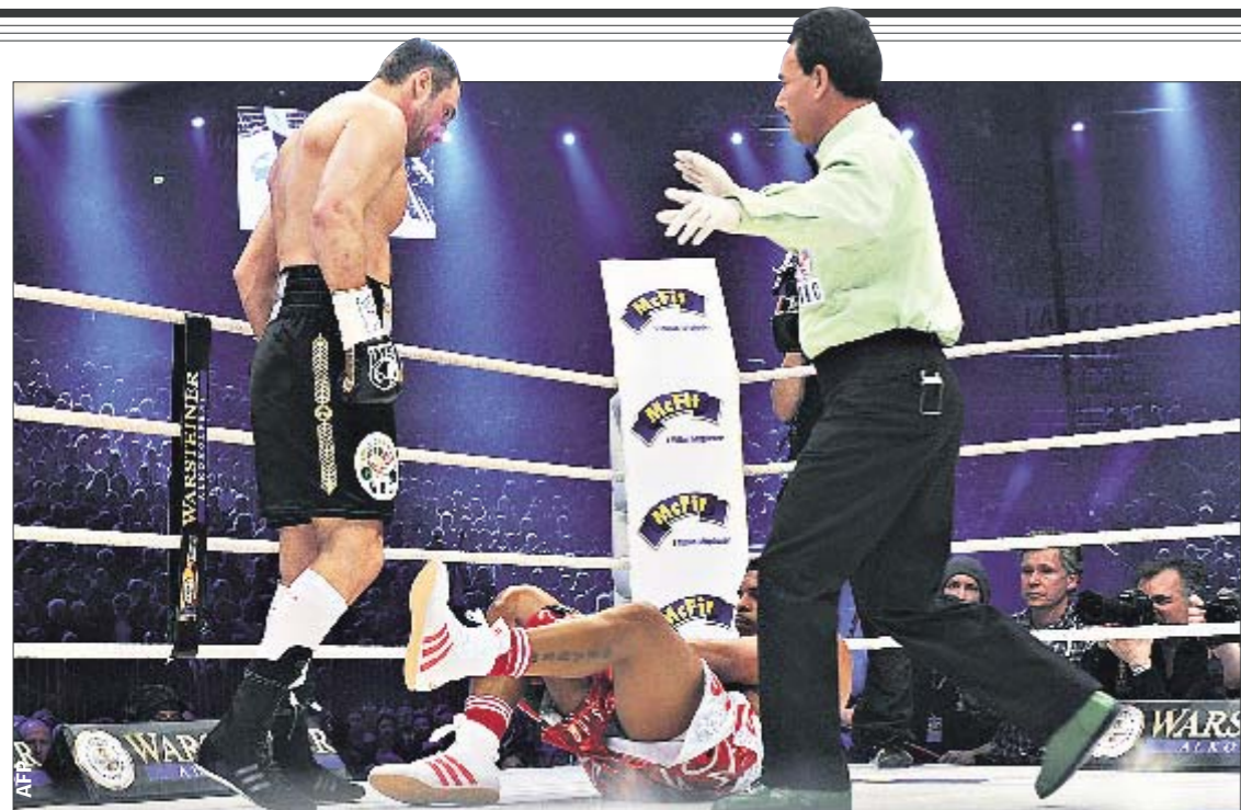
Сссолис... Виталий Кличко выиграл уже в первом раунде впервые за 10 лет