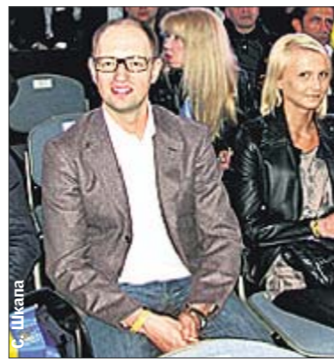
Яценюк. Впервые на боксе «за бугром»