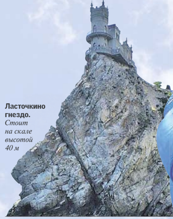
Ласточкино гнездо. Стоит на скале высотой 40 м.