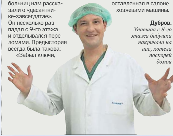
Дубров. Упавшая с 8-го этажа бабушка накричала на нас, хотела поскорей домой

РУКИ И ПОДУШКА. И немного о везении. В Париже полторагодовалый ребенок выпал из окна 8-го этажа и, по счастливой случайности, остался невредим, так как приземлился прямо... в руки прохожему. В Китае десятилетний ребенок упал с 20-го этажа на стекло автомобиля, и его спасла подушка, оставленная в салоне хозяевами машины.