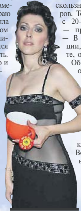
Экстрасенс: «Человек может замедлить скорость падения»