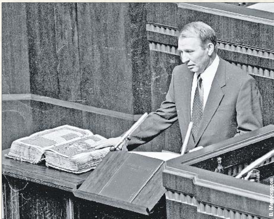
Присяга. Кучма вступил в должность 19 июля 1994 года

Кроме того, большинство директоров промышленных предприятий Донбасса, ведомые тогдашним и.о. премьера Ефимом Звягильским, работали на Кравчука (что было логично, раз они и так были при власти). Именно на их помощь рассчитывал Леонид Макарович, чтоб нейтрализовать агитацию Кучмы в крупнейшем русскоязычном регионе страны. Но вышло все по-другому. Донецкий народ своих боссов не послушался и проголосовал за Кучму, который обещал бороться с коррупцией и восстановить отношения с Россией. Для «боссов» это закончилось плохо — тот же Звягильский после победы Кучмы на выборах был вынужден покинуть страну и эмигрировал в Израиль (вернулся только в 1997 году, став полностью лояльным к президенту политиком).