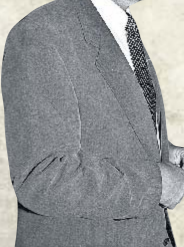
Юрий Мешков. Обещал российские пенсии, а сам уехал на пенсию в Москву