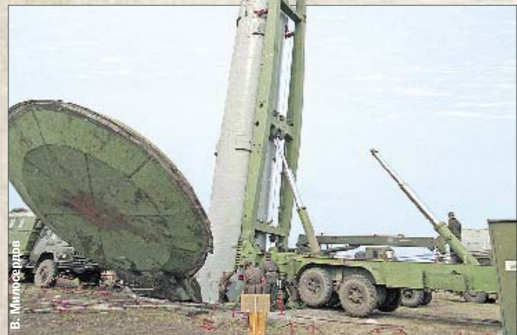
Их больше нет. За отказ от ядерной мощи мы не получили гарантий

держав. И альтернативой отказу была бы только международная изоляция и, в перспективе, потеря независимости страны. Другой вопрос, что отказ от ядерного оружия можно было бы продать дороже. А вот тут-то как раз у нас мало что получилось. Главная проблема — нам так и не дали четких гарантий безопасности. «Будапештский меморандум» на саммите ОБСЕ 1994 года о гарантии безопасности Украине со стороны «ядерного клуба» оказался пустой бумажкой, механизм их обеспечения так и не разработали. Леонид Кучма потом вспоминал: «на этом саммите тогдашний президент Франции Франсуа Миттеран сказал: «Сынок, не верь этому документу, тебя обманут». С тех пор было немало заявлений наших политиков о том, что надо бы нам обзавестись атомной бомбой (даже на последних выборах этот пункт был в программах некоторых кандидатов в президенты). Специалисты, готовые это сделать, у нас есть. Но нужны еще миллиарды долларов и новая техническая база. Да и, в конце концов, кто ж нам это все даст сделать? Становится «европейским Ираном» никому не хочется.