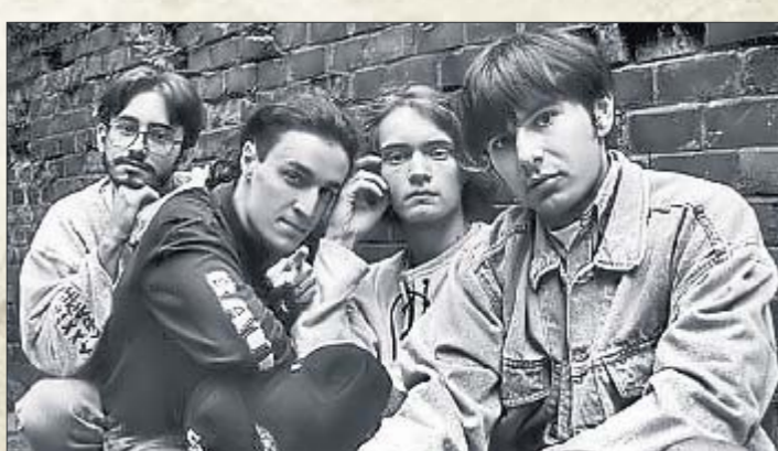
Еще не легенда. Их концерты будут собирать полные площадки

делом решили изменить название. Нам показалось, что «Океан Эльзы» — очень звучно». Святослав оказался плодовитым автором, уже через несколько недель группа принялась записывать первую студийную кассету из песен на украинском и английском. Первый концерт «Океана Эльзы» прошел через пару месяцев возле Львовского оперного театра, через два года группа побеждает на фестивале «Червона рута» и вскоре переезжает в Киев. На сегодняшний день в активе «Океана...» — семь альбомов и звание одного из главных рок-коллективов страны. Да и гонорары у них немаленькие: $20—$25 тыс. за выступление.