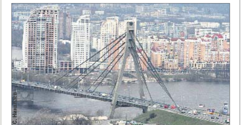
Московский. Здесь по утрам проехать непросто

Когда президентский вертолет выйдет на финишную прямую, то взору Януковича предстанет киевская Гидропарк. И в летнюю пору президент сможет по-доброму «подкалывать» премьер-министра, позвонив ему с вопросом: «Николай Янович, лечу мимо Гидропарка, женщины уже лежат в купальниках, а где же инвесторы?»