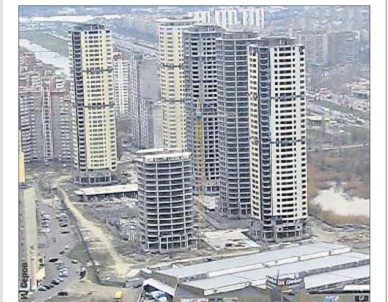
Долгострой. Шесть замороженных «свечек» на Троещине