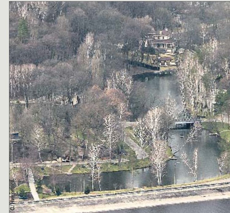
Свой залив. Через него можно пройти по красивому мостику