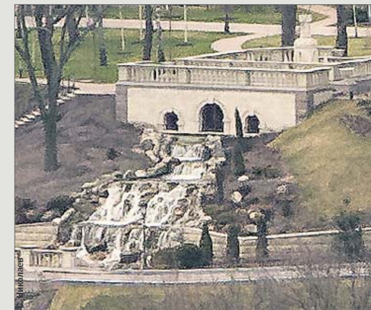
Со вкусом. Рядом с клубным домом — многоярусный водопад