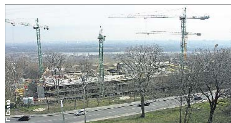
На финише. Достраивают последний ярус

объект действительно на финише. «Свою работу наши строители закончат через три недели, после чего в течение двух месяцев будет устанавливаться радиолокационное оборудование», — рассказал нам глава компании «Основачас» вот ставим «скелеты» — это будущие бетонные опоры. Потом начнутся отделочные работы. Я здесь работаю три месяца. Очень нравится — зарплата у меня 5000 грн., но есть спецы — и по 8 тысяч в месяц получают». Официально в компании, которая строит вертодром, нам подтвердили, что