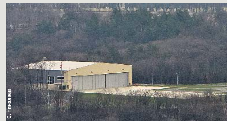
Вертодром в Межигорье. Отсюда Янукович будет лететь на работу