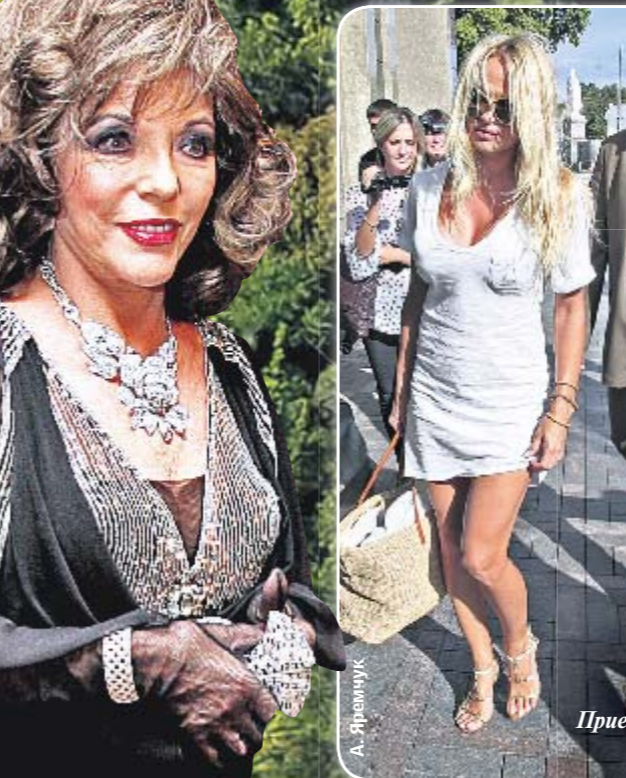
Памела Андерсон. Приехала не в духе и больше к нам не хочет