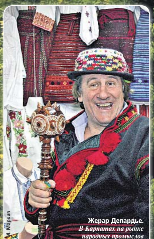
Жерар Депардьё. В Карпатах на рынке народных промыслов