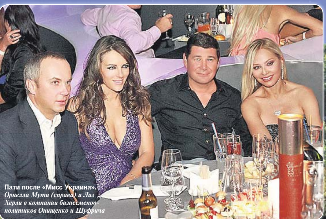
Пати после «Мисс Украина». Орнелла Мути (справа) и Лиза Херли в компании бизнесменов-политиков Онищенко и Шугрича

► Сталлоне в Киеве останавливался в отеле «Премьер Палас» (в номере за 2000 евро в сутки), по городу ездил в джипе «Рендж Ровер» с охраной. Успел «Рембо», в отличие от Лундгрэна и Стэтхэма, и по столице погулять, рассказав забавную историю: «Я как-то снимался в фильме, а в перерыве пошел к себе в вагончик, где меня ждала девушка. Вот только забыл снять микрофон с рубашки. Съёмочная группа, которая все слышала, потом еще долго вспоминала о моих любовных подвигах!».