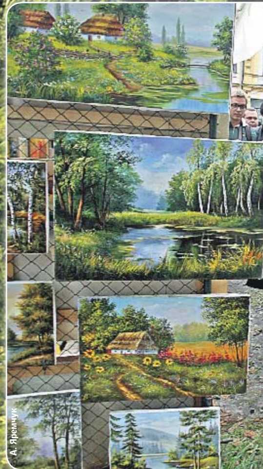
Орнелла Мути. Гуляя по Андреевскому спуску, присмотрела картину с морским пейзажем, но узнав, что она стоит 300 грн., отказалась ее покупать