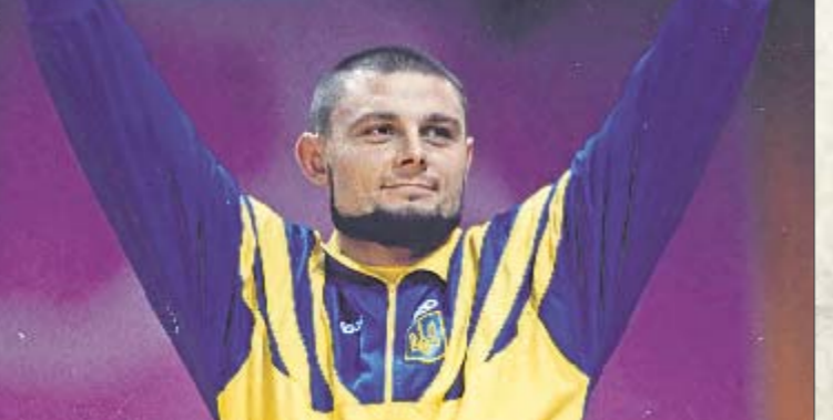
Первый «золотой». Боец Вячеслав Олейник дал старт рекорду