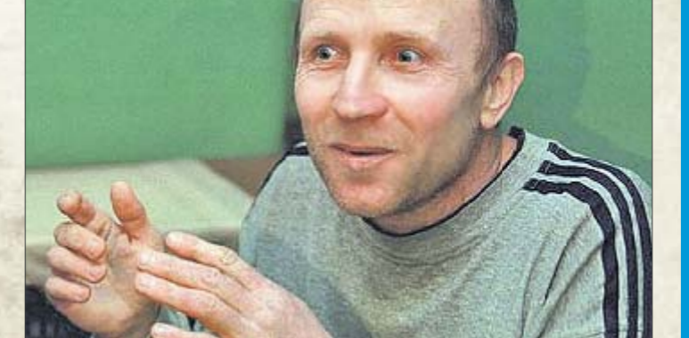
«Терминатор». Убивал для того, чтобы сирот становилось больше