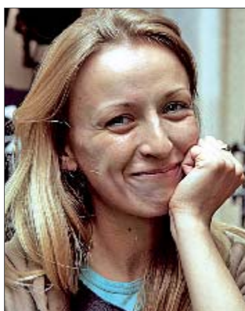
Ей предстоит покорить Де Ниро

Все актеры, задействованные в «Кроссе» — сплошь непрофессионалы. Даже персонажа «училка физры» играет реальная преподавательница. Сняли фильм довольно быстро — управились за каких-то пять дней. Снимать же выезжали на натуре — в парк Славы, Бортички и Пушчу-Водицу. Бюджет