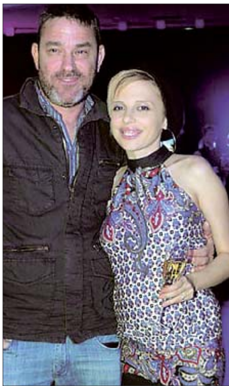
Карпа. 8 месяцев назад родила дочь