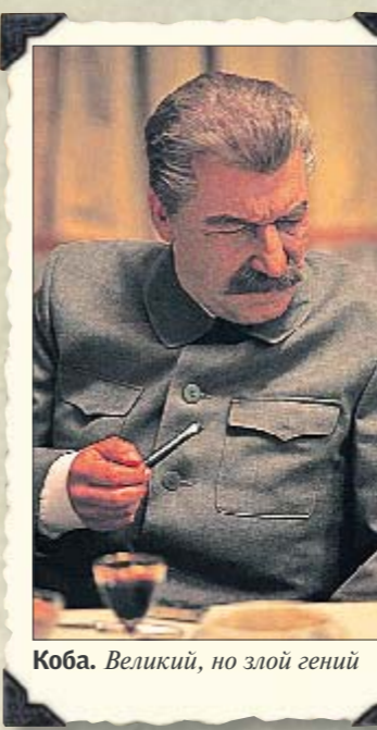
Коба. Великий, но злой гений

■ Еще одной из причин, побудивших Михалкова взяться за продолжение, стал образ Сталина. Так, в первом «Солнце» герой Никиты Михалкова — человек, преклоняющийся перед великим отцом всех наций Сталиным и его идеями. Что, впрочем, не спасло его от репрессий. В «Предстоянии» образ генералиссимуса уже утратил свое божественное свечение. Теперь он просто демон, которого Котов ненавидит до такой степени, что даже душит (окуная ненавистное усатое лицо в кремловый торт с шоколадным профилем товарища Кобы) в своих неспокойных снах. В «Цитадели» образ вновь эволюционировал. Теперь это уже и не человек вовсе, а вампир, готовый положить тысячу жизней ради своей цели и который рассуждает: «15 000 человек это много или мало? Для одного участка фронта, может, и да. А