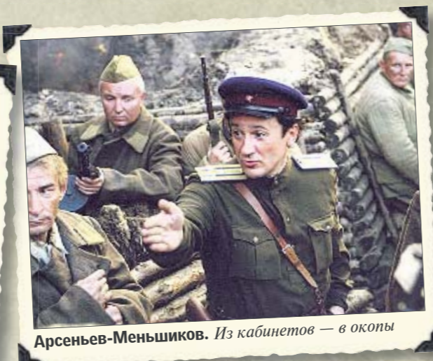
Арсеньев-Меньшиков. Из кабинетов — в окопы