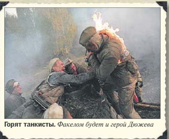
Горят танкисты. Факалом будет и герой Дюжева