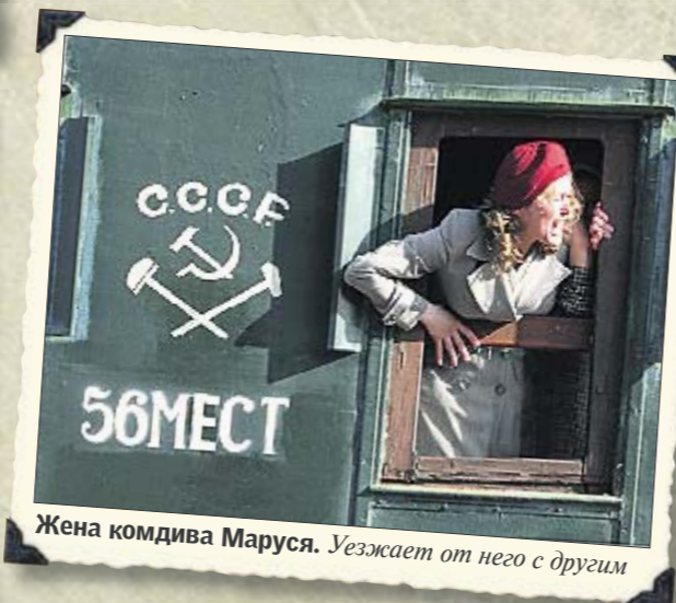
Жена комдива Маруся. Уезжает от него с другим