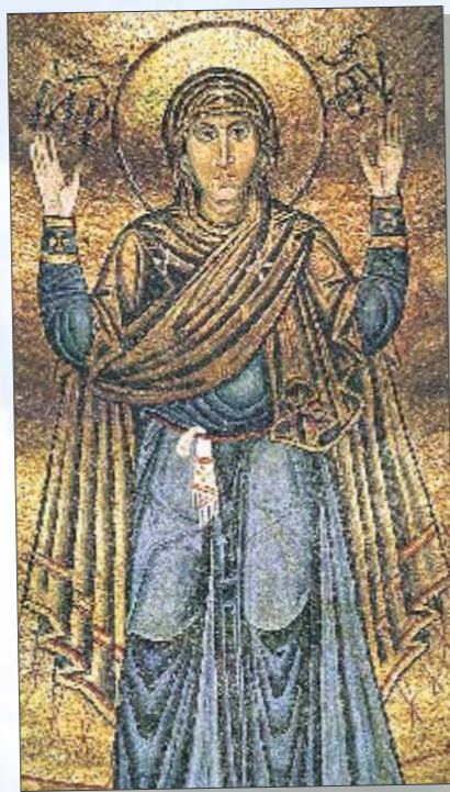
«Богоматерь Оранта»: по легенде пока стоит эта мозаика в Софии Киевской — стоит и столица Украины

■ Небесным покровителем Киева считается Архангел Михаил. Но первым покровителем Киева был Архангел Гавриил — вестник Божьей воли (именно он сообщил Марии весть о будущем рождении Иисуса). По одной из версий, он утратил главенство из-за многочисленных войн — киевляне стали почитать покровителя ратников Архангела Михаила. Есть и еще одна теория, объясняющая, почему Киев охраняет именно Архангел Михаил: считается, что первого киевского митрополита, прибывшего из Византии, звали Михаил.