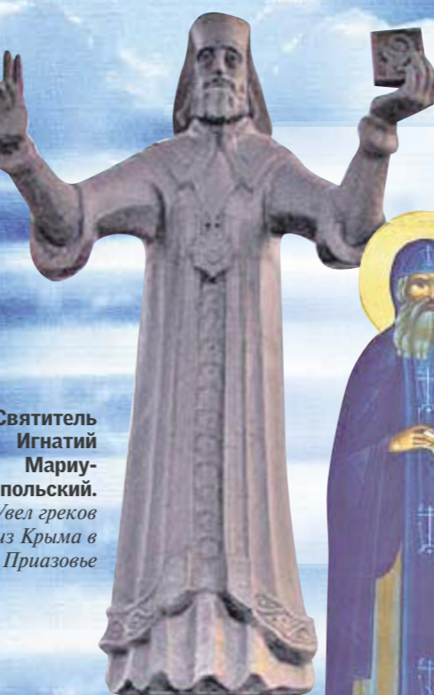
Святитель Игнатий Мариупольский. Увел греков из Крыма в Приазовье