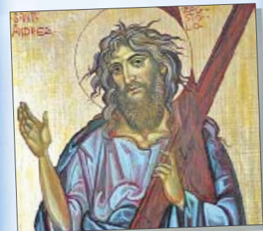
Апостол Андрей Первозванный