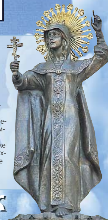
Святая Екатерина. Украшает фасад епархиального управления