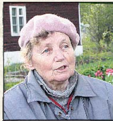
«Я даже откладываю немного!»